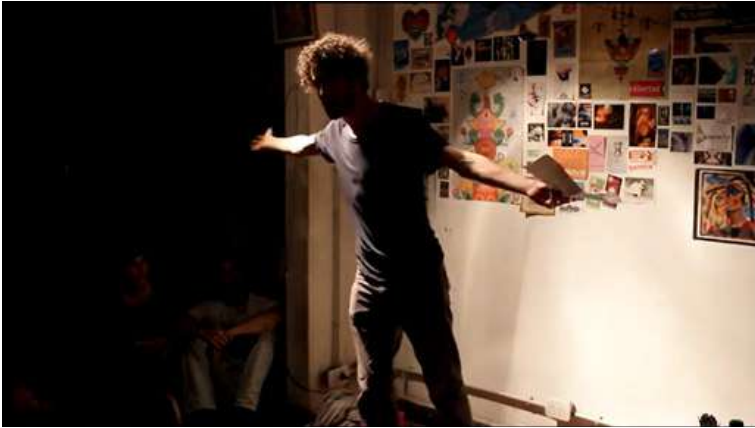
E. Barenboim 2. Captura de pantalla de un registro subido a YouTube, propiedad del Slam Zona Sur.