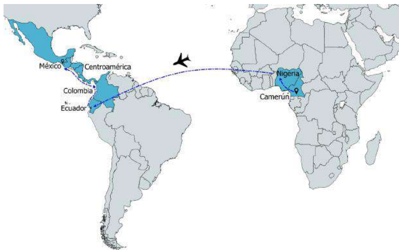
Mapa 7. Ruta migratoria Camerún-Nigeria-Tapachula