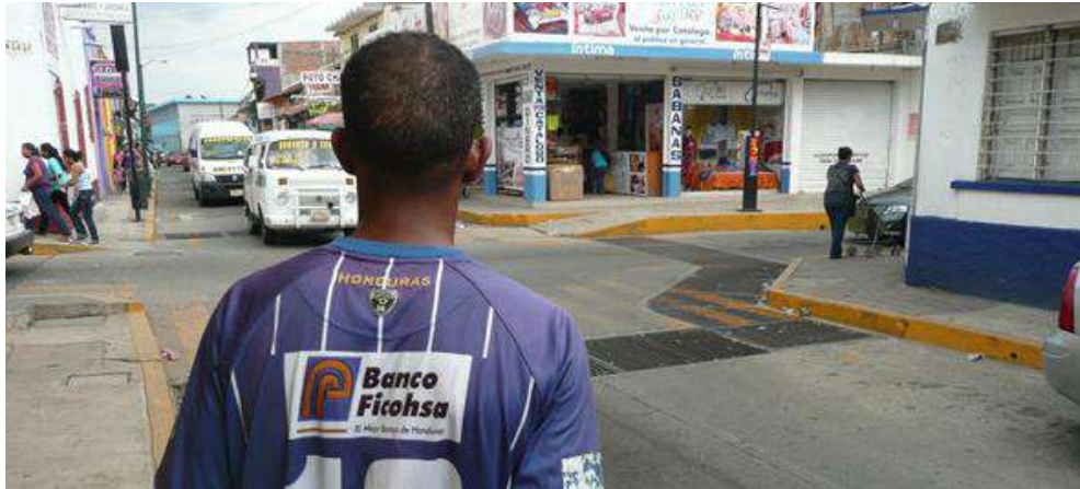
Foto 3. Eritreo portando la playera de la selección nacional de Honduras

Fuente: Foto de Jaime Cinta, mayo de 2010.