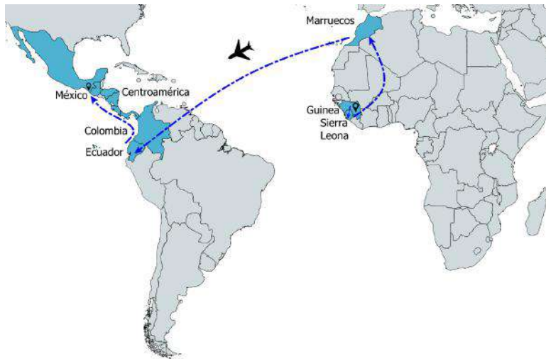
Mapa 9. Ruta migratoria Guinea-Sierra Leona-Tapachula

armas. De Colombia a Panamá caminé ocho días en la floresta y pasé por una montaña, no hay comida, perdí un amigo mío en el camino y no comí tres días. En Ecuador yo tenía un guía y en todos los países tenía a un guía que me ayudó a salir de los países. Ellos te llevan a las fronteras. Con ellos van otros más que van buscando Estados Unidos, yo me uní a varios grupos (Aluca, 15 de marzo de 2016, Tapachula).