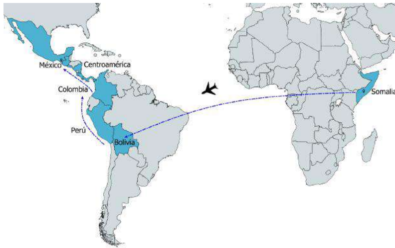
Mapa 5. Ruta migratoria Somalia-Bolivia-Tapachula