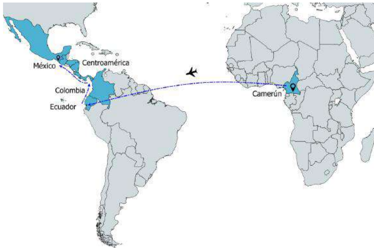
Mapa 3. Ruta migratoria Camerún-Tapachula

xico. Yo me moví a pie, me movilicé en autobuses y viajé en botes en el mar. La parte Ecuador-Colombia fue en autobús. De Colombia a Panamá viajé en el mar por medio de un bote, y de Panamá me fui en autobuses a los demás países. Algunas partes del camino las hice caminando. Cuando vas de un lugar a otro necesitas que te muestren el camino, es por eso que tenemos que pagar a guías. Cuando te muestran el camino debes pagarles. Esto me sucedió en Panamá, en Costa Rica y en la frontera Nicaragua-Honduras. Yo he gastado aproximadamente 1 200 000 francos de África Central 29 (Efrén, 16 de diciembre de 2015, Tapachula).