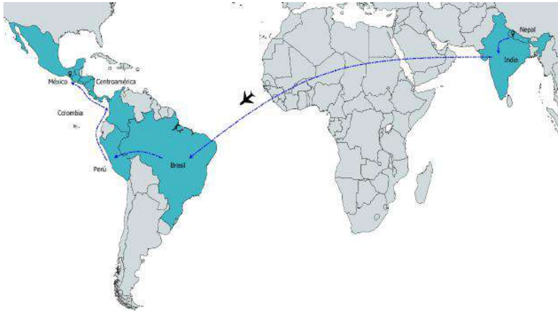
Mapa I2. Ruta migratoria Nepal-India-Tapachula