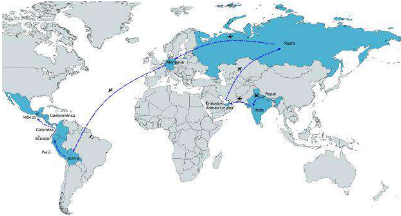
Mapa 13. Ruta migratoria Nepal-India-Dubái-Rusia-Tapachula