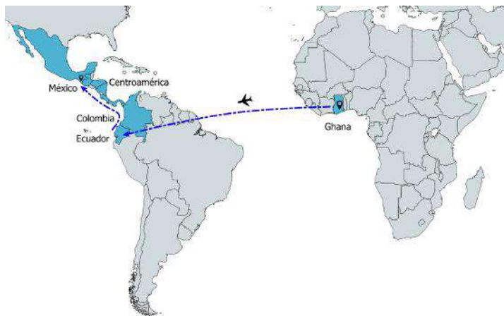
Mapa 4. Ruta migratoria Ghana-Tapachula

Yo pasé de Ghana para Ecuador en avión. Después, de Ecuador me trasladé a Colombia en autobús. Hice algunos amigos que me decían dónde tenía que pasar, me decían “pase, pase” o algunas instrucciones. Viajé en autobuses pequeños y tomé un bote de Colombia a Panamá, fueron dos horas de viaje. De Panamá a Costa Rica y Nicaragua también viajé en autobuses. En Costa Rica y Nicaragua fue un gran problema porque estuve entre “tribus” por tres días y para dormir en algún lugar tenía que dar dinero. Luego, para entrar a las fronteras me pedían 10 dólares, 15 dólares o 20 dólares por día. De Nicaragua me trasladé a Honduras, tardé como tres días en el autobús para entrar a este país. De Honduras viajé a Guatemala y en Guatemala no encontré migración, por eso no tuve ningún problema en Guatemala. Después de Guatemala llegué aquí, a México. Lo difícil es entrar a Colombia y Nicaragua, los policías se dedican a robar, pero no individualmente sino en grupos. El costo de este viaje fue de 5 000 dólares (Alfonso, 22 de agosto de 2015, Tapachula).