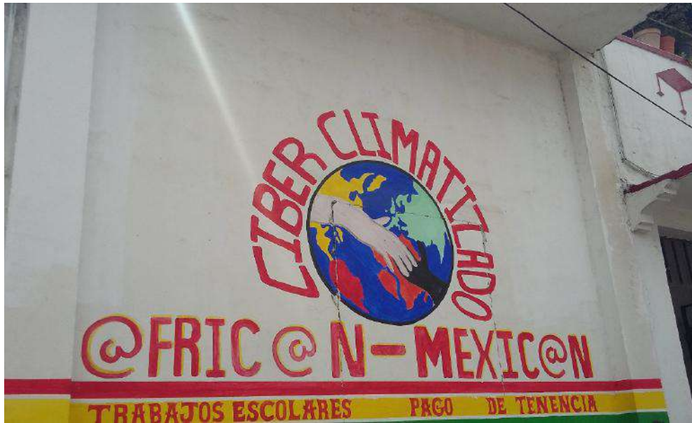
Foto 5. Cibercafé African-Mexican