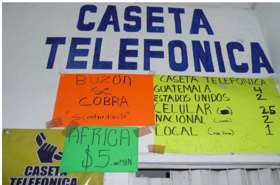
Foto 6. Caseta telefónica en el centro de Tapachula