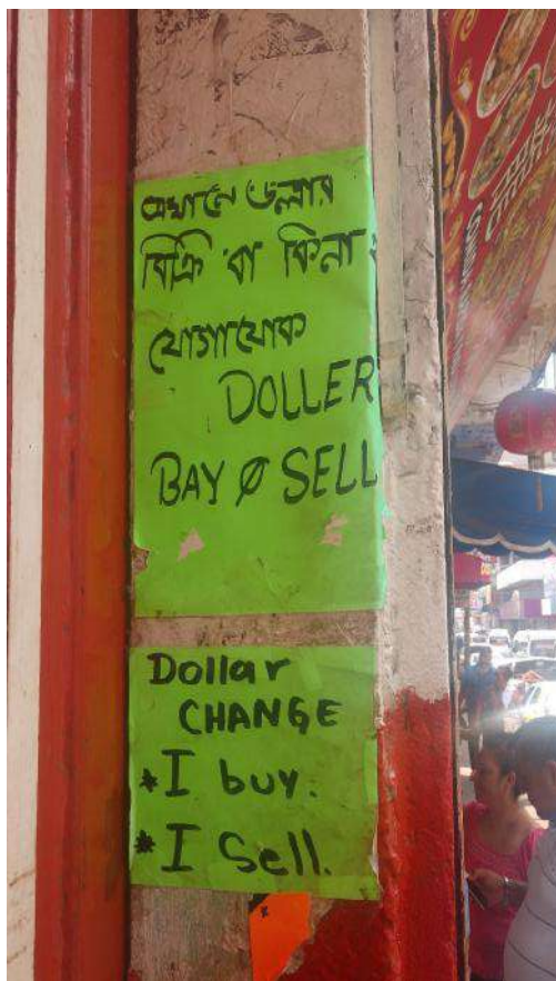
Foto 9. “Se cambian dólares”. Exterior del restaurante de Mamá Asha