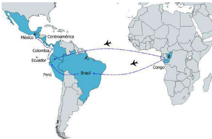
Mapa 2. Ruta migratoria Congo-Tapachula