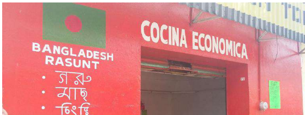
Foto 7. Restaurante de comida asiática en la 8va Avenida Norte, en el centro de Tapachula

Fuente: Foto de Jaime Cinta, septiembre de 2015.