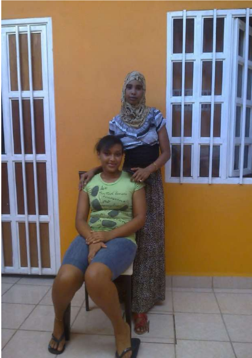
Foto 4. Mujeres eritreas en un hotel del centro de Tapachula