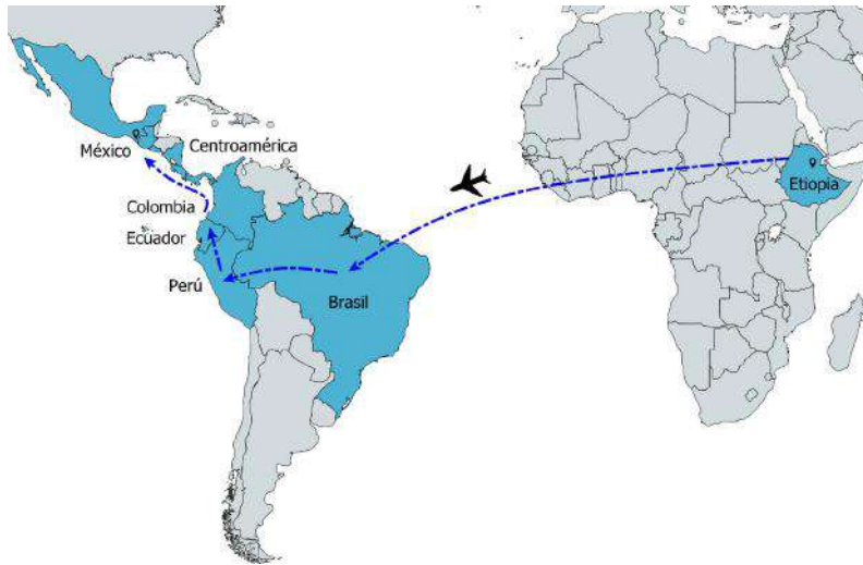
Mapa 1. Ruta migratoria Etiopía-Tapachula