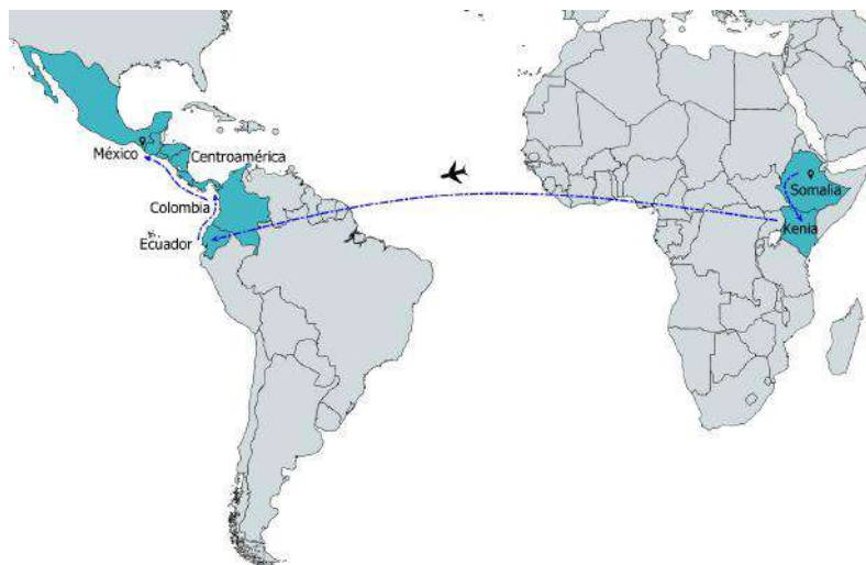
Mapa 6. Ruta migratoria Somalia-Kenia-Tapachula