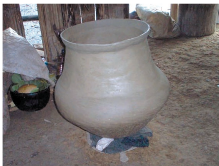
Cerámica tradicional sarayaqueña elaborada por Eloisa Gualinga