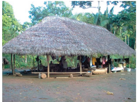
Casa tradicional sarayaqueña