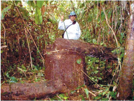
Arbol sagrado de Lispungo derribado por la CGC