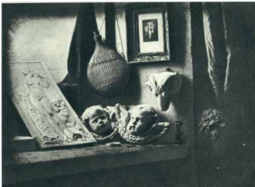
Dagerrotipo tomado en 1837, por Louis Jacques Mande Daguerre, en Francia.

En Inglaterra, hacia 1841, Willian Henry Fox Talbot descubre y patenta un proceso fotográfico al que nombra «Calotipo». Este se lleva a cabo impresionando en la cámara papel de escribir sensibilizado con sales de plata, lo cual produce un negativo que se positiva por contacto sobre otro papel igual con la luz del sol. El calotipo tiene, por un lado, una desventaja, y por otra parte, una gran virtud con respecto al daguerrotipo: su imagen es burda en comparación con la de este, pero por producir un negativo permite reproducir cada imagen tantas veces como sea necesario 3 .