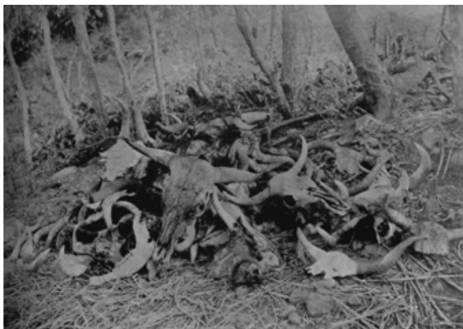
Imagen realizada por el fotógrafo venezolano Henrique Avril, en 1903, en la zona central del país.

Con relación al grado de desarrollo comparativo que tuvo la disciplina entre nuestros distintos países durante el siglo XIX y la primera mitad del XX, es de suponer que eso haya estado vinculado, en forma más o menos proporcional, al grado de crecimiento que experimentaron los factores económico, demográfico, institucional y cultural occidental en cada una de las naciones. Razonamiento este que en cierta forma queda verificado, ante el hecho de que los países en los cuales se conservan actualmente más obras originales de esa época son Argentina, Brasil y México, los cuales desde los tiempos de la colonia tuvieron un alto nivel en estos renglones dentro del concierto regional.