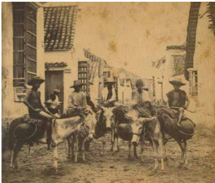
Imagen realizada por el fotógrafo estadounidense Camilo Farrand, en Venezuela, en 1865.

que en el aspecto cultural está lo suficientemente occidentalizado como para permitirles ejercer la profesión.