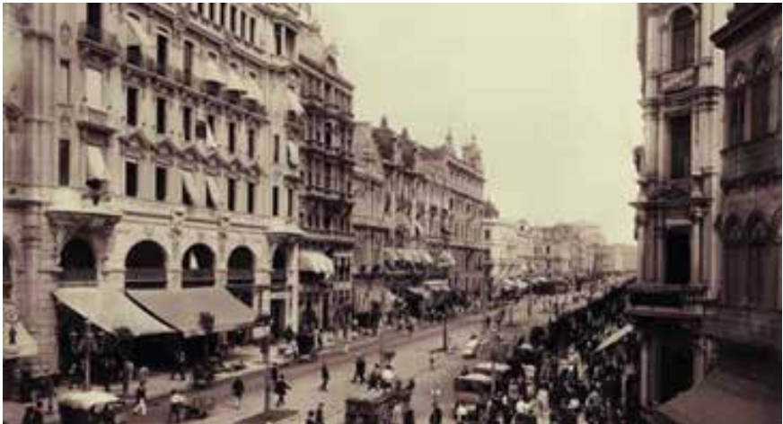
Gráfica hecha por el fotógrafo brasileño Marc Ferrez, en su país, en la década de 1880

período mantiene su permanencia hasta la década de 1930, cuando en la fotografía latinoamericana comienza el tiempo de la «Modernidad»; es importante destacar en este punto, que aunque cronológicamente existe una alta concordancia entre esta etapa positivista que estamos explicando y el tiempo del «Art Nouveau» en los países hegemónicos, ambas manifestaciones obedecen a realidades socioculturales diferentes, y, en consecuencia, sus estilos son distintos. Esto se debe a la relativa incomunicación que aún para estos años prevalece en el mundo, que permite el desarrollo de procesos culturales más o menos autónomos en las distintas zonas.