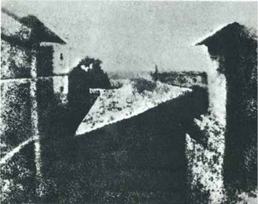
Heliografía realizada por Joseph Nicephore Niepce, en Francia, en 1826

Trece años después, en 1839, también en Francia, Louis Jacques Man- de Daguerre, trabajando sobre la base de lo investigado por Niepce, hace pública su técnica del «Daguerrotipo». Esta nueva modalidad consiste en exponer dentro de la cámara oscura una lámina de cobre sensibilizada que produce una imagen de gran detalle. Empero, este método que inicialmen- te disfruta de una inmensa popularidad, comparte una característica con la Heliografía que lo hará obsoleto a la vuelta de pocas décadas, produce una imagen positiva por cada exposición, siendo cada una de estas irreproduci- bles 2 .