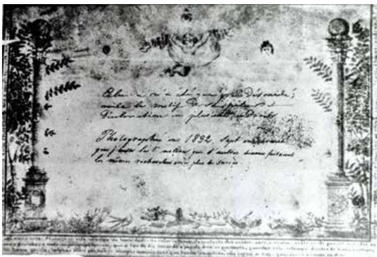
Gráfica tomada por el fotógrafo italiano Benito Panunzi, en la Argentina, en la década de 1860