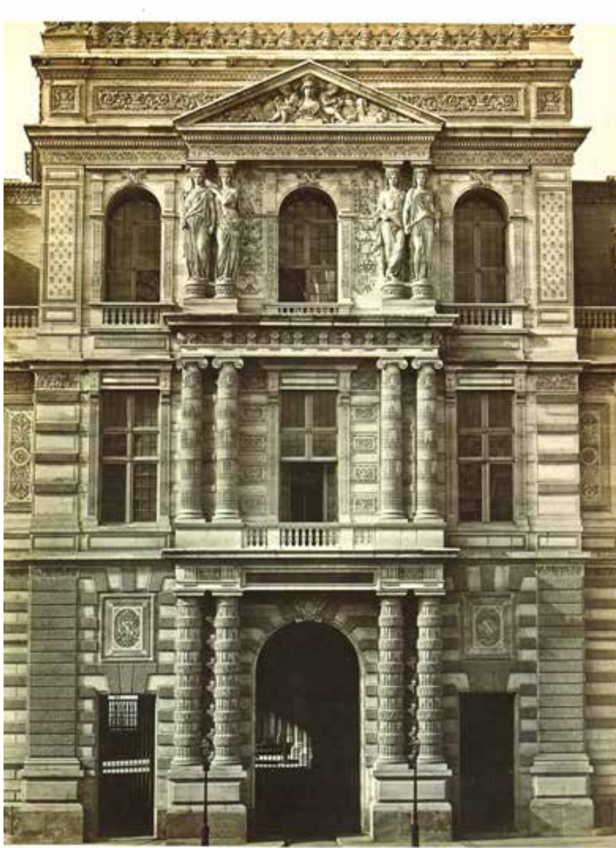
Albumina realizada por Eduard Denis Baldus, en Francia, en 1855