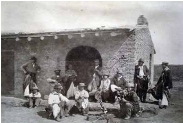
Fotografía hecha por el investigador franco-brasileño Hércules Florence, en Brasil, en la década de 1830