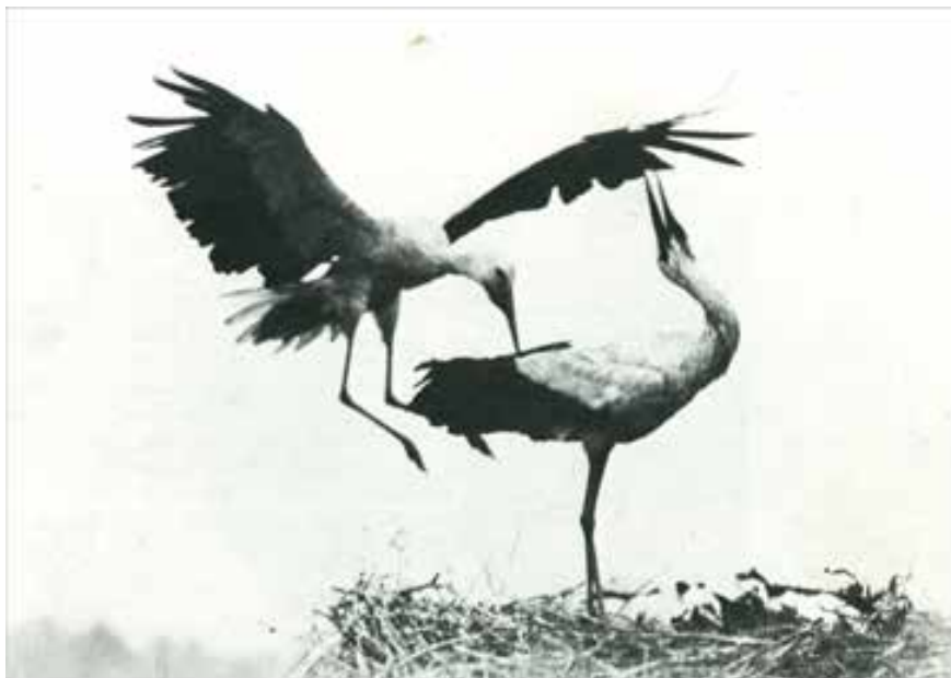
Placa Seca hecha en Alemania, por Ottomar Anschutz, en 1884

En Inglaterra, para 1873, Richard Kennett inicia la venta de placas ya listas para su uso, en las cuales se utiliza como medio de suspensión para las sales de plata, ya no el viscoso colodión, sino gelatina seca. Esto revoluciona una vez mas la profesión, porque libera a los fotógrafos del engorroso trabajo de preparar las placas en el sitio; además, este nuevo material es mucho mas sensible que los anteriores, permitiendo lo que nunca antes se había logrado, exposiciones de fracciones de segundo. Esta modalidad mantiene su vigencia hasta los finales del primer tercio del siglo XX 6 .