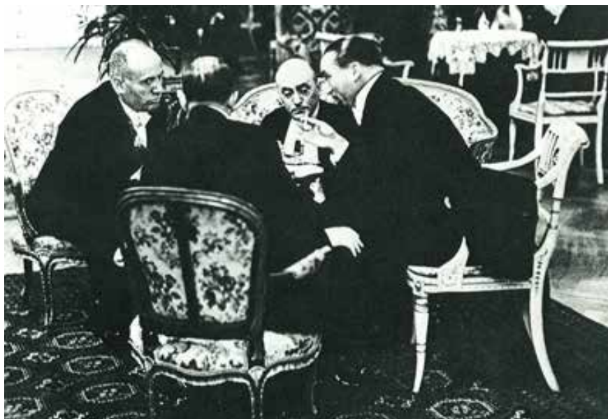
Fotografía tomada con una cámara Leica, en 1931, por Erich Salomón en Italia

milímetros, cuyo primer ejemplar es la «Leica», lanzada al mercado por Oscar Barnack y Ernst Leitz, desde Alemania en 1925 8 .