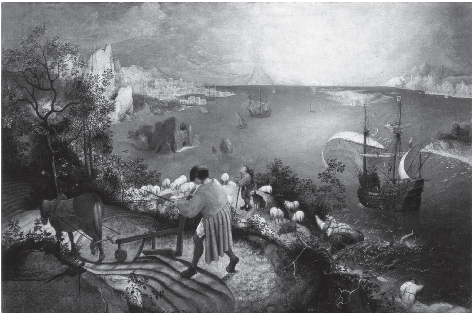
Paisaje Con Caída De Ícaro. Pieter Brueghel El Viejo.