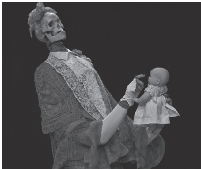
Odin Teatre Archives / Performance: Ave María/ Dir.: Eugenio Barba / Foto: Tommy Bay.

Arduo trabajo de laboratorio del cuerpo que, trascendiendo la narración de una historia, se instala en el terreno performático por medio de la imagen visual y vocal para generar desde allí su discurso poético, en nada lineal, hecho a fuer de yuxtaposiciones espaciales y temporales en las que se entreveran mascarón y actriz, en pos de la recomposición de la memoria, de las tensiones, de la grandeza del personaje. Tarea avanzada más no acabada, como lo advierte Varley, y por eso mismo, rica en la verdad que enseña, en tanto muestra del batallar del cuerpo, de la imaginación en función investigativa, en riguroso proceso de búsqueda frente al reto que impone una exigente resolución estética motivada por la vida y obra de la actriz.