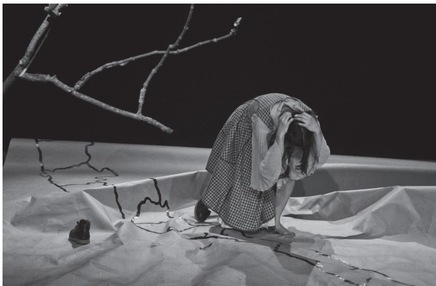
Obra: Tierra De Fuego / Dir.: Julia Varley

Es decir, que conmueve por la operación de des cubrimiento, ligada, más que a la “verdad” a secas, a lo que alude el término aletheia , ese des velamiento con que los griegos nombraban el hecho de dejar a la vista lo latente — lethein —, aquello que ha estado oculto o se ha llevado el Letheo , lóbrego río del olvido, del silencio. “Descubrimiento” hecho a la vez en las potencialidades del cuerpo que podemos resumir en palabras de Julia Varley cuando dice: “Carolina tenía confianza en los conocimientos de su cuerpo y miedo de su voz: “No sé cantar, no sé decir textos”, me dijo. Y por allí empezamos” (Pizarro, 2013).