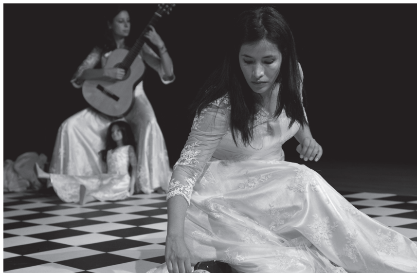
Obra: Anónimas / Dir.: Julia Varley

Y en medio de un juego de no pocas resistencias está presente el cuerpo, incluso desde el temor o las carencias de las actrices ante los desafíos del trabajo, según su propio testimonio. Pero en todo caso, más allá de las resistencias, son cuerpos que encarnan la necesidad de volver sobre lo que no han vuelto otros, de mirar hacia donde generalmente mira con desdén la Historia: hacia la mujer, niña o adolescente, joven o adulta que desde su confinación en el espacio y en el tiempo, encuentra en el rito teatral una digna forma de visibilización en la revaloración de sus experiencias, de su historia, que a la vez involucra parte de la historia de las ofiantes. Como en un salón de espejos, la historia de sí del cuerpo, multiplica su imagen en infinitos fractales que dan cuenta a la vez de uno y del todo, de lo particular y de lo universal de una vivencia que hace parte de nosotros.