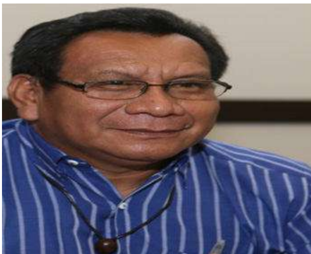
Figura 4 – Gersem Baniwa

O papel exercido por Gersem Baniwa não só na academia e na política, mas sobretudo na sociedade e na divulgação da história, memória e cultura indígena, tem um papel extremamente relevante para esses povos, pois descortina uma série de questões que além de agregar, também evidenciam a cultura, os costumes, as tradições, a língua, entre outras nuances dos povos da floresta.