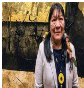
Figura 6 – Joênia Wapichana