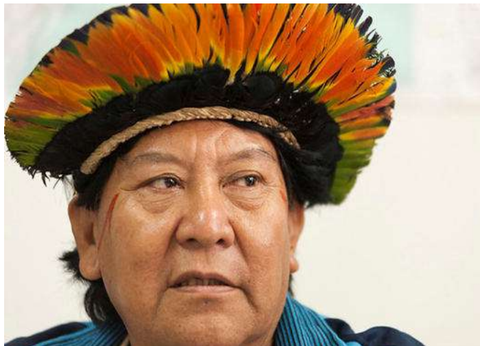
Figura 2 - Davi Kopenawa

abordando parte da trajetória de Davi Kopenawa, xamã e liderança do povo da Terra Indígena Yanomami, localizada no estado de Roraima. Sua luta em defesa dos direitos do povo Yanomami é reconhecida no Brasil e no exterior, principalmente pelo seu engajamento no processo demarcação dessa Terra Indígena (TI) em 1992 e da batalha contra a invasão do garimpo.