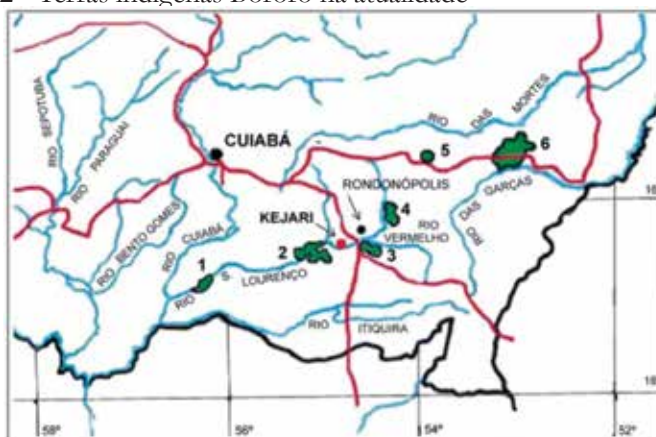
Mapa 2 - Terras indígenas Bororo na atualidade

conhecidos na etnologia como Bororo “independentes” (Serpa, 1988, p.49, Viertler, 1990, dentre outros) ou “livres” (Wust, 1990, p.99), tiveram seu território invadido, de forma inexorável, por várias frentes de colonização. Forças políticas e econômicas compunham o campo de relações entre Bororo e colonizadores, dentre elas: a implantação das linhas telegráficas; a Missão Salesiana; as frentes agropastoris vindas de Goiás e Minas Gerais; a frente extrativista de diamantes, composta, sobretudo, por nordestinos; a implantação de colônias agrícolas pelo Estado de Mato Grosso, inclusive em terras demarcadas para os Bororo; a Fundação Brasil Central.