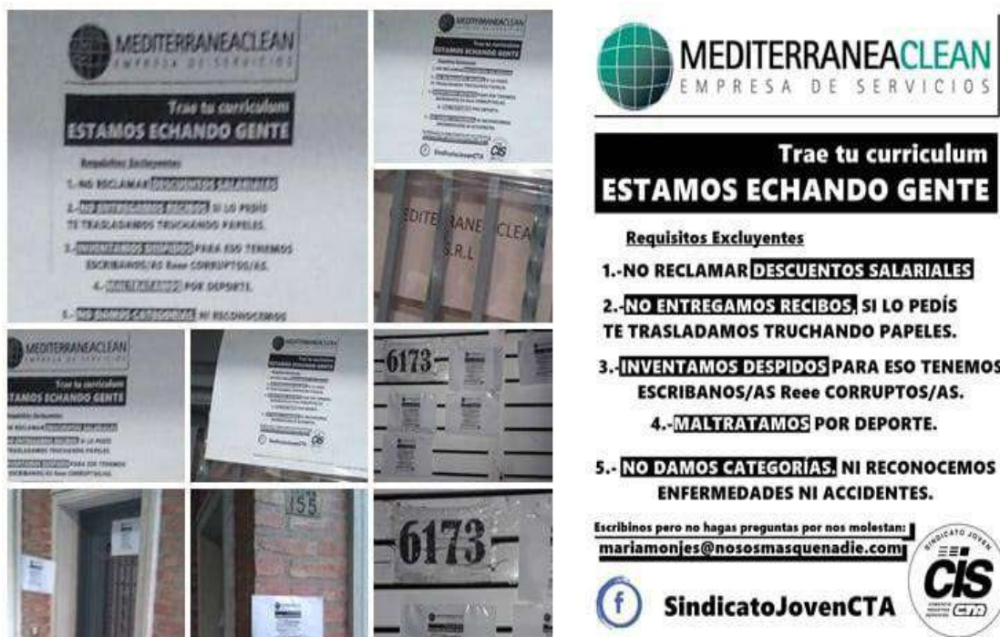
Imagen 1. Folleto elaborado por el Sindicato Joven CIS

Fuente: Publicación del Sindicato Joven CIS en su página de Facebook ( https://www.facebook.com/SindicatoJovenCIS/photos/a.356048351405214/1320111924998847/ )