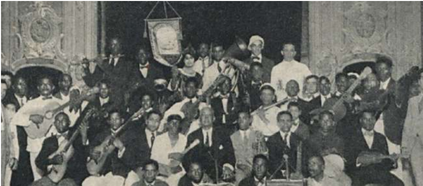
Imagen 1. Flor do Abacate