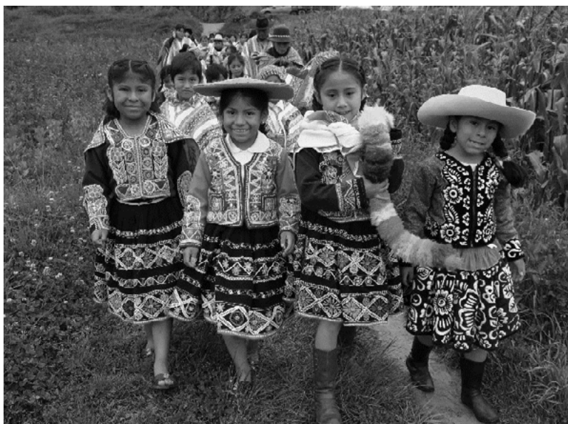
Figura 2. Niñas y niños de la institución educativa “Glorioso 791” de la ciudad de Sicuani participando en la siembra de maíz

En el proceso de la crianza de la chacra se fortalecen los valores andinos: