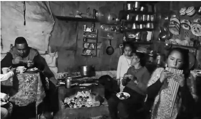
Figura 3. “La pedagogía de la Tulpa”, Concierto musical alrededor de la Tulpa, Vereda Bajo Casanare

La propuesta no es solo la interpretación de las obras musicales, si no compartir estas en el seno familiar y que este ejercicio cultural y musical sirva como puente de unión y reflexión para los integrantes de las familias de mis estudiantes; volver a lo primigenio cuando la música hacía parte de ese círculo de saberes y diálogos ancestrales de nuestros antepasados; a esta estrategia la he denominado “La pedagogía de la Tulpa”. La tulpa como lugar de recogimiento espiritual dentro del hogar, que con sus fuegos y sus cenizas en torno a la bendición de los alimentos hace que el encuentro en familia sea el momento más importante del día. En este punto, una de las actividades propuestas es un concierto familiar alrededor de la Tulpa, en la cual interpretarán las obras propuestas en el repertorio escogido conjuntamente con ellos.