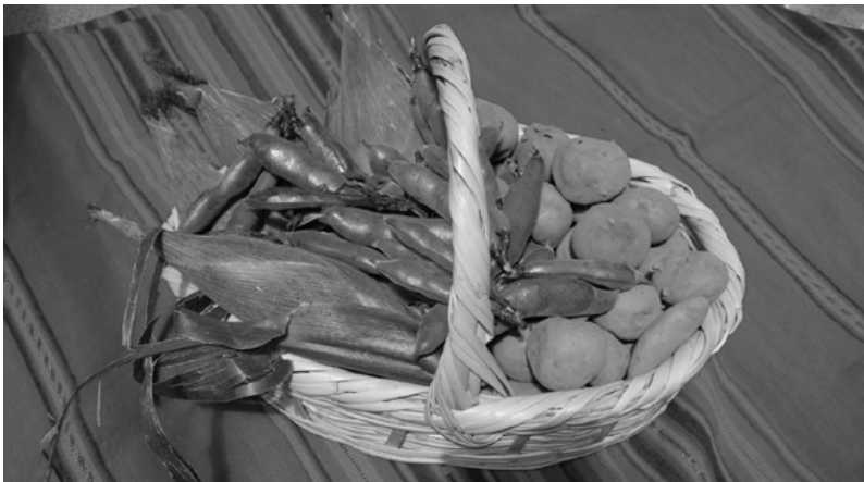
Figura 5. Canasta con choclos, habas y papas que enviaron las familias de las comunidades a las ciudades en tiempos de pandemia

Esta circunstancia de la pandemia nos coloca en el momento preciso para retomar, fortalecer y comprender la importancia y el valor que debemos dar a la agricultura y, en especial, a la crianza de las chacras escolares y familiares; puesto que estos espacios de aprendizaje y producción han sido la despensa de alimentos en estos tiempos de pandemia. Las cosechas han servido para alimentarse en el momento preciso que los mercados se cerraron y también muchas familias del campo enviaron encomiendas de productos (papas, choclos, habas, arvejas, ollucos, ocas, mashuas) a sus familiares en las ciudades. De este modo, las chacras escolares y familiares cumplieron un rol fundamental en el abastecimiento de alimentos sanos y nutritivos en momentos de escasez y confinamiento en nuestros domicilios.