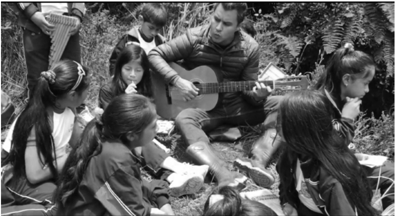
Figura 1. Práctica musical conjunta Vereda San Gabriel antes de la pandemia. IEM El Socorro

Es así, como se empieza a revisar lo esencial: un saludo; un abrazo; una mirada inesperada; el ruido de la calle; en las escuelas, la melodía perfecta del rizoma que une cientos de voces. Miles de pensamientos y palabras de sujetos pensantes, el corazón de la educación, nuestros estudiantes, que en un pasado cercano veíamos casi imposible y en el cual, el contacto con los estudiantes y las melodías que fluían, como fluye el río en las verdes veredas, era imprescindible para el quehacer docente y el aprendizaje significativo que, como maestros, queremos para con nuestros estudiantes. Si bien estamos en una situación ajena a un sistema educativo estandarizado, las políticas educativas pensadas en un futuro lineal, permanente, con cambios imprescindibles, debemos adaptarnos a esta nueva realidad y luchar por una educación virtual de calidad.