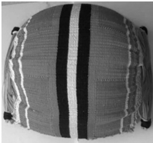
Figura 2. Cesto pari ( kuño ) kamayurá de la artesana Mapuálu Kamayurá

Una vez generado en el kuño el espacio curvo de geometría hiperbólica, este se cierra, práctica y artificialmente, en los cuatro bordes mediante un nudo que une los tres o cuatro ejes inclinados; y con este amarre se convierte en una útil pieza artesanal, un implemento de pesca. Como instrumento de la vida cotidiana, regresa al universo de los objetos reales, pero lleva consigo el dibujo de la geometría imaginaria en su forma física, al igual que el tipiti , que lleva incrustada en su forma material la imagen real incompleta, pero completa en el nivel de lo imaginario, de la botella de Klein.