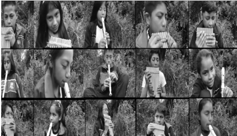
Figura 2. Salida de campo, práctica y composición musical. IEM El Socorro