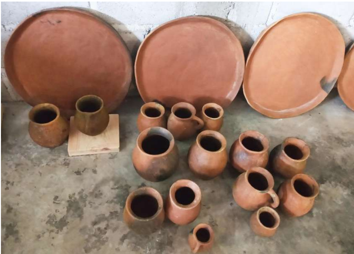
Colectivo de Alfarería