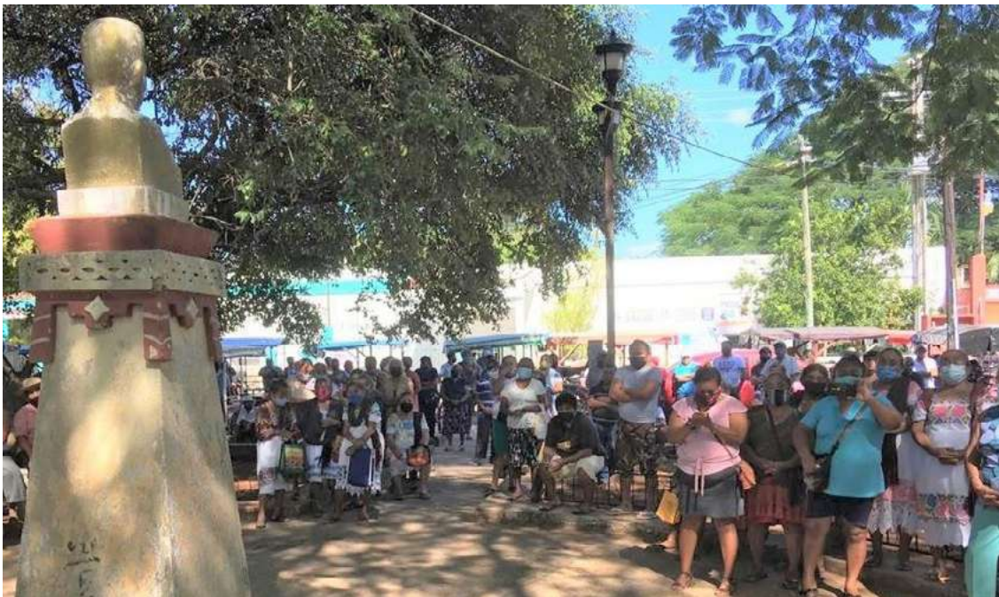
Asamblea en el ejido Halachó después de la remoción de representantes ejidales por posibles actos de corrupción en contubernio con FONATUR y Procuraduría Agraria.

Lo anterior es claro, porque contrario a lo que señalaba constantemente el presidente mexicano sobre la supremacía constitucional resumida en el principio “Nada ni nadie por encima de la constitución”, con el acuerdo en mención, el presidente mexicano se desdice colocándose él y a su gobierno por encima del Pacto Federal que es justamente la CPEUM. Y no faltamos organizaciones sociales que tal como con anteriores gobiernos, le recordamos esto al presidente, por ello, le somos incómodas e incómodos los defensores y las defensoras de la naturaleza y los derechos humanos.