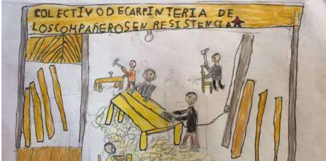
Dibujo realizados por las niñas y niños zapatistas de la comunidad

Gracias a la organización estamos resistencia de como sobre Vivir creando colectivos de producción, Educación y salud Tenemos carpintería, Artesanía de Bordados, colectivos de pollos, colectivos de Hortalisa colectivo de plantas medicinales, colectivos de alfaleña. Estamos muy alegres de seguir luchado con el colectivo somos niños y niñas, guardianes y guardianas de la madre tierra, no somos Provocadores. Estamos luchado por la vida de la humanidad.