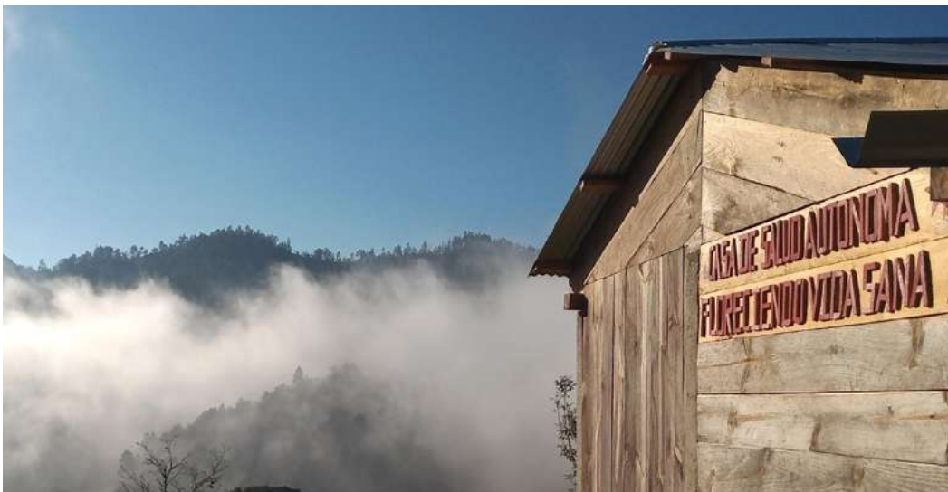
Clínica de Salud Comunitaria