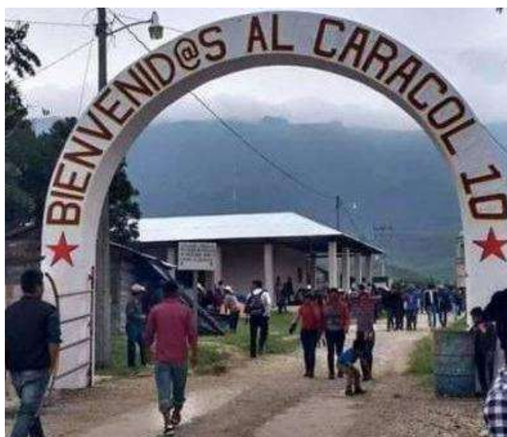
Caracol 10, Floreciendo la Semilla Rebelde.

La Comunidad Zapatista tzeltal-tsotsil de Nuevo San Gregorio está sembrada en 155 hectáreas de tierra recuperada. Son seis familias zapatistas, un aproximado de 58 personas que protegen, con un reconocido respeto, las tierras recuperadas . Se asumen como guardianas de la Madre Tierra y no como propietarios.