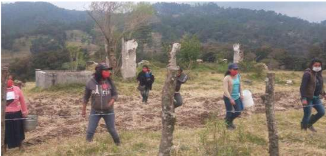
Invasión y cercamiento. Las mujeres tienen que arrastrarse para acceder al agua y leña.