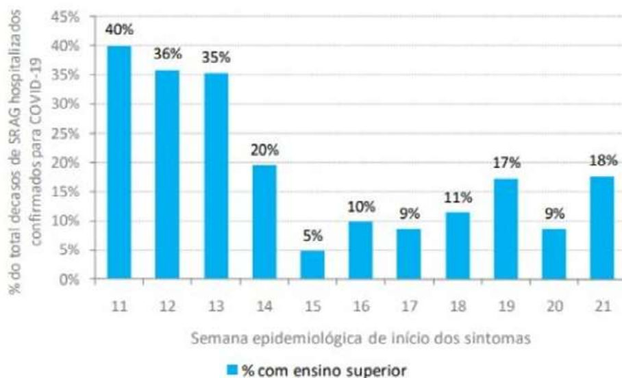
Figura 13. Proporção de indivíduos com ensino superior entre os casos hospitalizados confirmados para Covid-19, 2020, RS