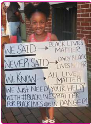
Una de las consignas de las las protestas en mayo 2020

La muerte de Trayvon fue decisiva para la creación en el 2013 del movimiento social #BlackLivesMatter (BLM) –las vidas negras importan–. El cual ganó visibilidad internacional después del caso de Michael. Una llamada de atención y una respuesta al virulento racismo anti-negro y las ejecuciones extrajudiciales de personas negras por parte de la policía y los vigilantes.