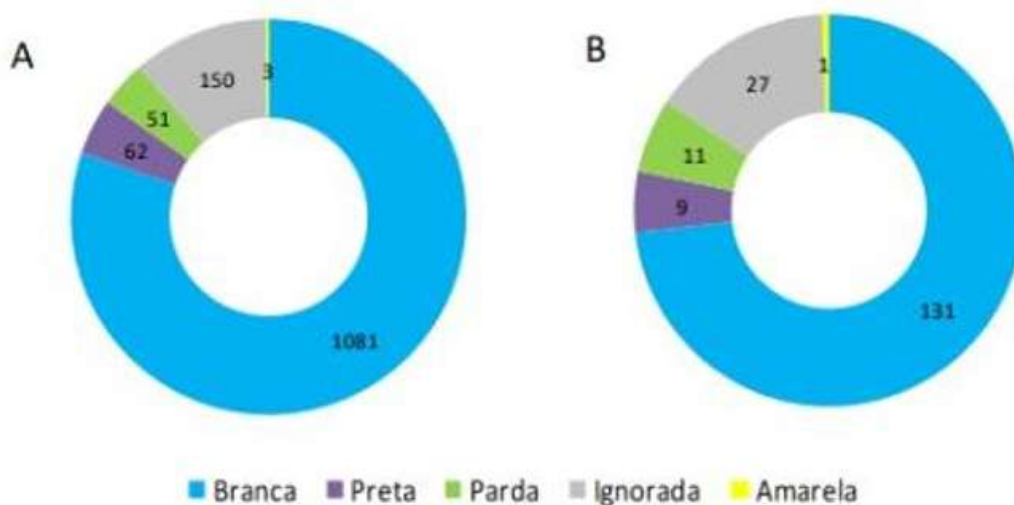
Figura 12. Casos SRAG hospitalizados (A) e óbitos (B), confirmados para Covid-19, segundo raça/cor, 2020, RS