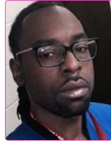
Philando Divall Castile