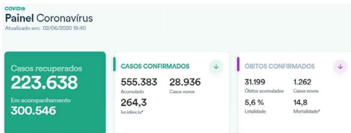
Cuadro 1: Distribución de los casos de COVID-19 en Brasil.