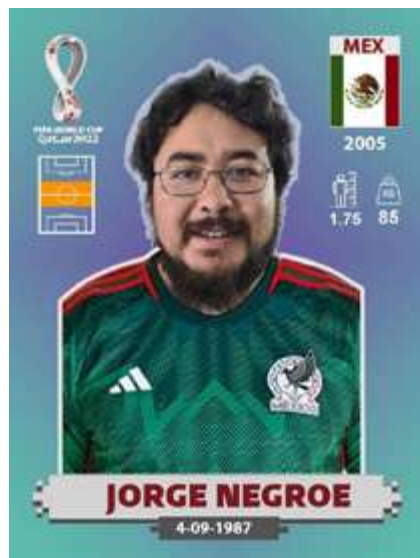
Cromo personalizado, ejemplo de apropiación de un producto cultural

Finalmente, en México los coleccionistas hacen una utilidad práctica del álbum (llenarlo para guardarlo o venderlo) y una simbólica (el “logro” de llenarlo, el status de tenerlo, pertenecer al grupo de coleccionistas, etc.), creando además sociabilización, apropiación, identificación y consumo cultural en el proceso.