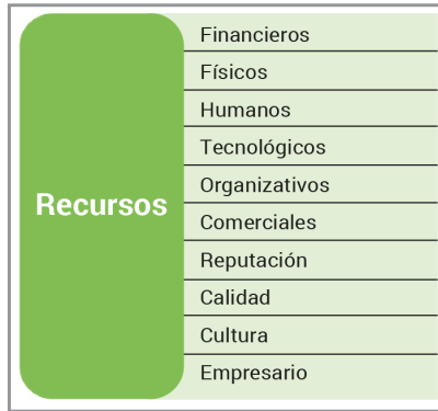
Figura 5. Recursos para el desempeño competitivo