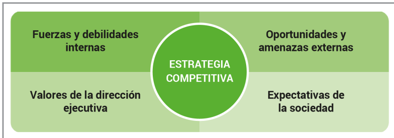
Figura 1. Factores clave de formulación estratégica