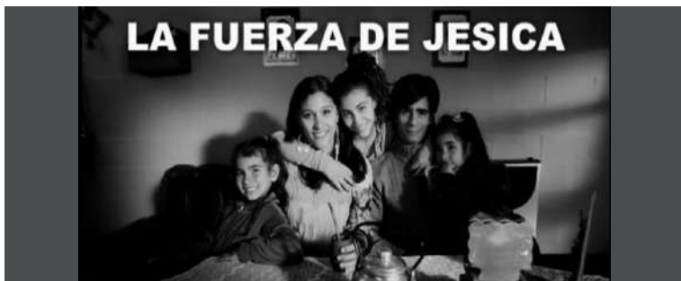
1. "La fuerza de" (aquí los nombres varían de acuerdo a cada spot).

La descripción de la secuencia final que comparten todos estos spots, producidos para las elecciones generales, es la siguiente: