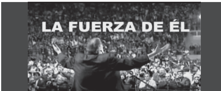
1. "La fuerza de" (aquí los nombres varían de acuerdo a cada spot).