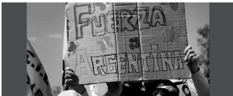
2. Distintas personas sosteniendo carteles con la inscripción "Fuerza Argentina".