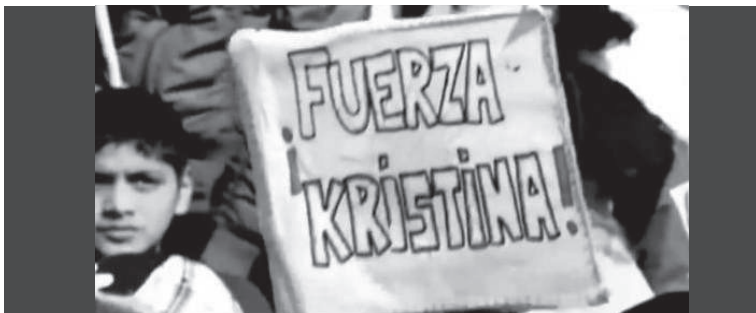
2. Distintas personas sosteniendo carteles con la leyenda "Fuerza Kristina".