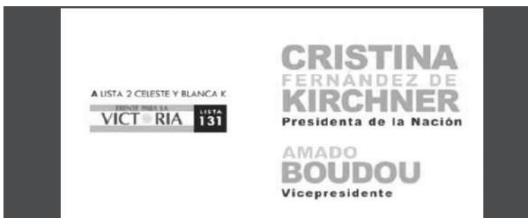
5. Fórmula electoral.

En la secuencia descrita se utiliza una imagen de Cristina Fernández de Kirchner vestida de blanco, mirado a una multitud de frente pero tomada por la cámara de espaldas. Todos los fragmentos elegidos para ilustrar los spots de esta campaña son imágenes de archivo, ya sea de actos donde participó Cristina Fernández de Kirchner durante su primer mandato o de acontecimientos significativos del gobierno –tanto del periodo 2003-2007 como del 2007-2011–. Al final de cada spot aparece la fórmula de campaña que, para las primarias de agosto la siguiente: “A lista 2