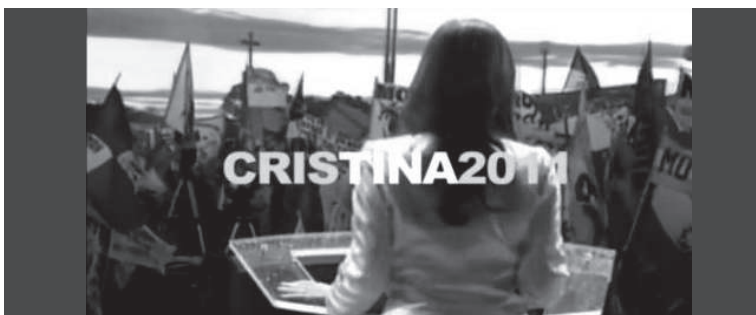
3. Cristina Fernández de Kirchner tomada por la cámara de espaldas frente a una multitud que la ovaciona con la inscripción "Fuerza Cristina" y luego "Cristina 2011".