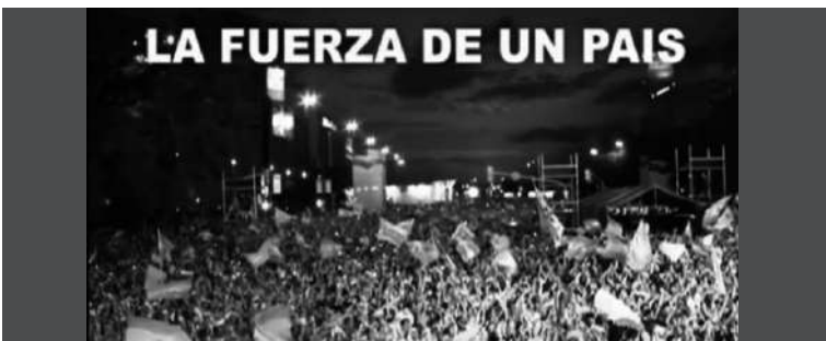
5. Imagen de una multitud agitando banderas y la inscripción: "La fuerza de un país"