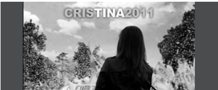
4. Cristina Fernández de Kirchner vestida de negro tomada por la cámara de espalda, de frente a una multitud con la inscripción "Cristina 2011".