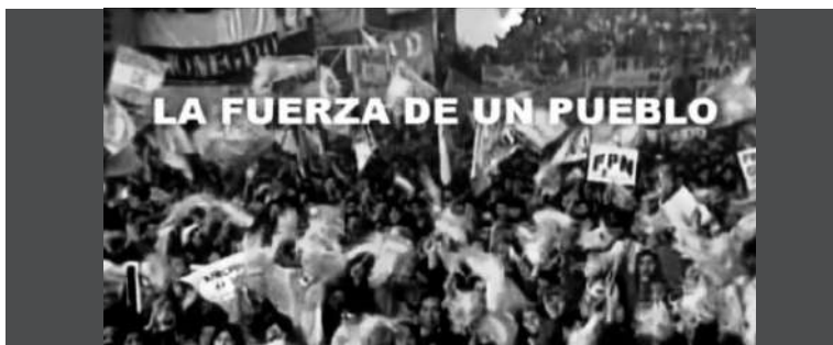
4. Imagen de una multitud agitando banderas celestes y blancas con la inscripción “La Fuerza de un pueblo”.