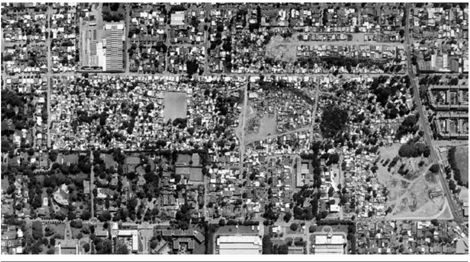
Figura 3 Ciudad fragmentada