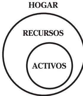
Figura 2: Recursos y activos