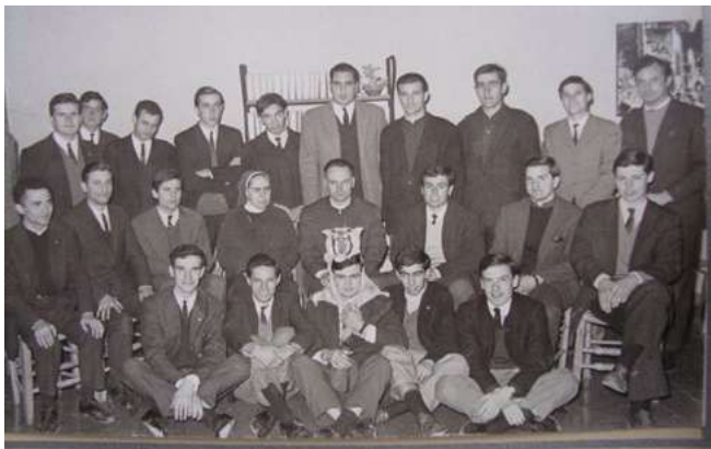
La Pequeña Hermandad, 1967.

Volviendo a la JUC bahiense, los jóvenes eran, en su mayoría, estudiantes de distintas carreras de la UNS o bien alumnos y egresados de la Escuela de Servicio Social, de la Escuela de Enfermería y del Instituto Juan XXIII. Algunos jucistas habían hecho sus estudios secundarios en colegios religiosos de la ciudad –fundamentalmente, en el Don Bosco, perteneciente a la Congregación Salesiana, y La Inmaculada, a cargo de la Compañía de María–, o de sus lugares de origen –dirigidos por diversas congregaciones y órdenes (salesianos, maristas, jesuitas o franciscanos capuchinos)–, y contaban con una trayectoria de militancia previa en el MFC, la Legión de María, 106 La Pequeña Hermandad 107 o las ramas juveniles de la ACA.