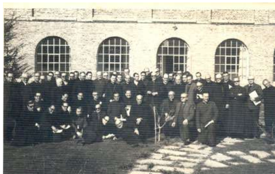
Reunión del clero local en el Seminario La Asunción, 1968.