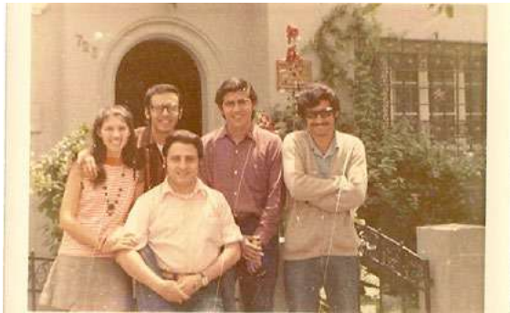
Miembros del SLA en la sede de Lima, 1971-1972.