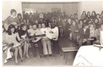
El coro y la misa en La Pequeña Obra.