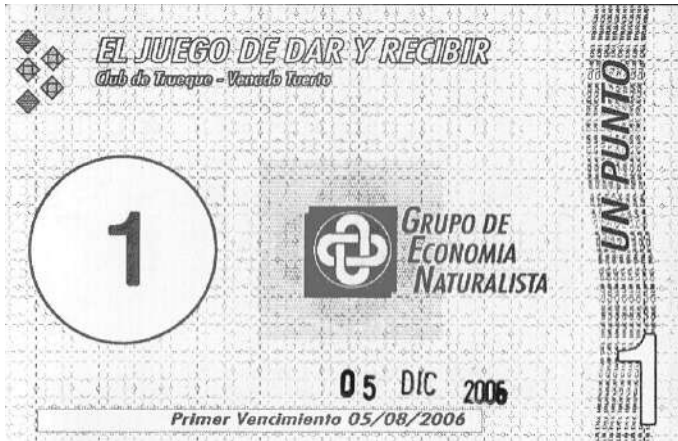
Billete en circulación desde el 05/04/06 al 05/12/06.