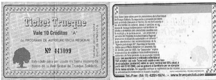
Red Global del Trueque (Argentina), 1995 a la actualidad.