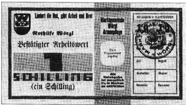
El Municipio de Wörgl (Austria), julio de 1932 a enero 1933.