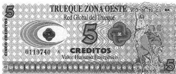
Red del Trueque Zona Oeste (Argentina)-1999 a la actualidad.