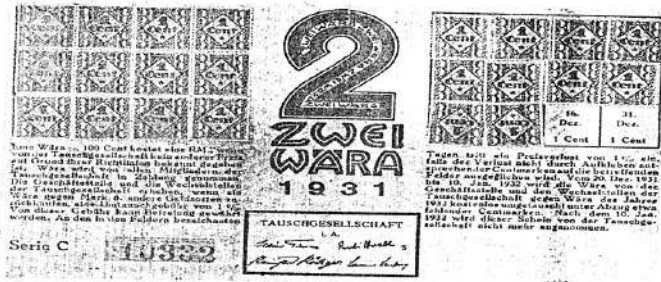
La primera experiencia. Los wära Erfurt (Alemania), octubre 1929 a octubre de 1931.