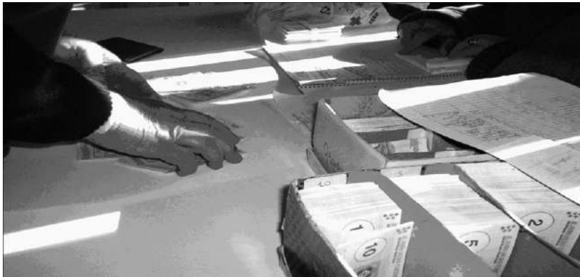
¿Cómo se oxida? Venado Tuerto (Argentina), agosto 2007.