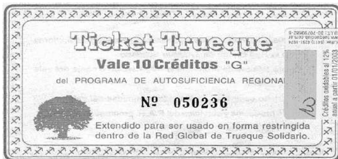
Venado Tuerto. Grupo de Economía Naturalista (Santa Fe, Argentina) 1999 a la actualidad.