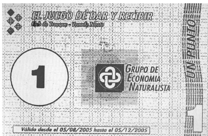
Billete en circulación desde el 05/08/2005 al 05/12/05.