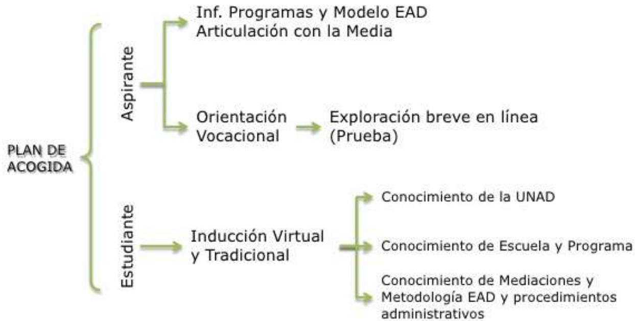
Figura 4. Plan de acogida dentro del Plan de Acompañamiento Psicosocial de la UNAD