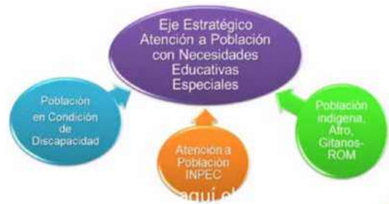
Figura 5. Estructura del Eje Estratégico de Atención a Población con Necesidades Educativas Especiales.

NEE con la participación de todos los estamentos de la Universidad. La Figura 5 muestra la estructura del eje actualmente.