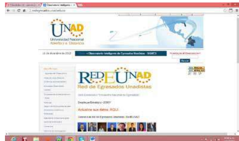
Figura 7. Red de egresados UNADISTAS

El desmovilizado además, tiene la posibilidad desde el inicio de su carrera ir incorporándose a los distintos proyectos productivos y sostenibles que la UNAD genera, ya que es necesario que logren proyectar en sus planes de vida, un componente sobre la generación de proyectos productivos para salvaguardar parte de su inclusión social. La Universidad en estos momentos cuenta en todas las Escuelas y en los CEAD del país, con espacios fortalecidos de alianzas con el sector productivo que podría facilitar esta inclusión. Es necesario, cuando inicie la fase de implementación de la propuesta, identificar esos espacios, acordes con el interés de estos estudiantes, para generarles puentes de articulación con dichos sectores.