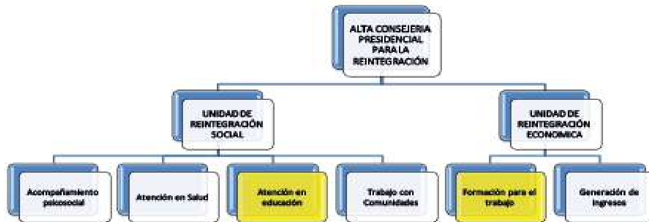
Figura 2. Estructura del proceso de reintegración.