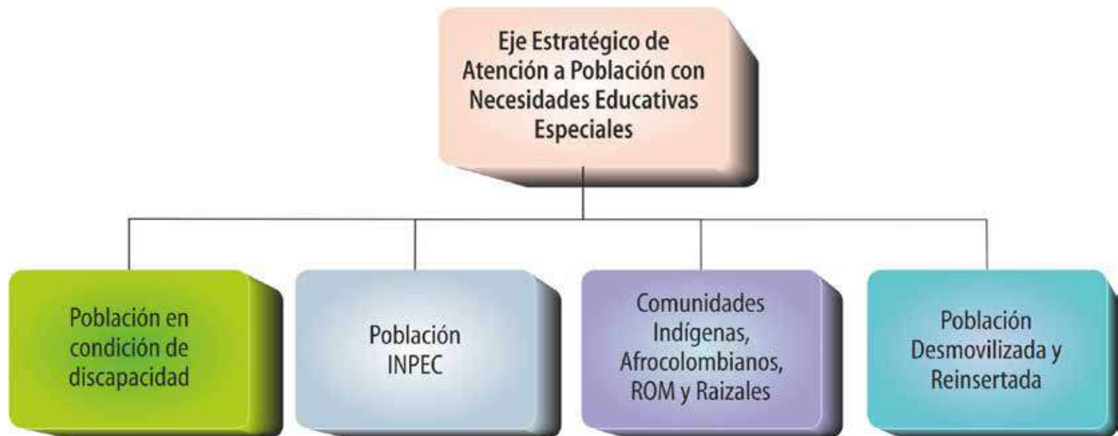
Figura 6. Propuesta para la reestructuración del Eje estratégico de atención.

por esto, que la propuesta pedagógica tiene varias fases durante su implementación que inicia desde la acogida de los estudiantes en su proceso formativo, hasta su incorporación como egresados unadistas con impronta social solidaria. La nueva estructura propuesta para el eje sería: