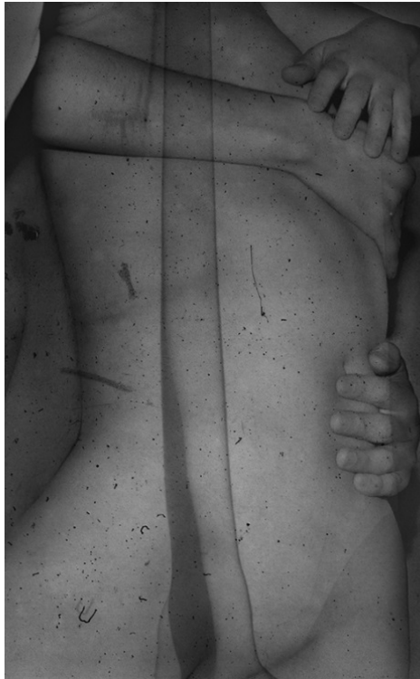
Fotografía de Daisuke Yokota, de la serie Corpus.

Recibí una carta un mes después. Todo estaba bien, se les había hecho fácil conseguir heroína. Me enviaron esta fotografía: