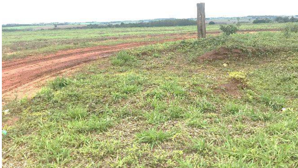
Ilustración 2: Frontera seca entre Paraguay y Brasil en Canindeyú, con uno de los hitos de demarcación