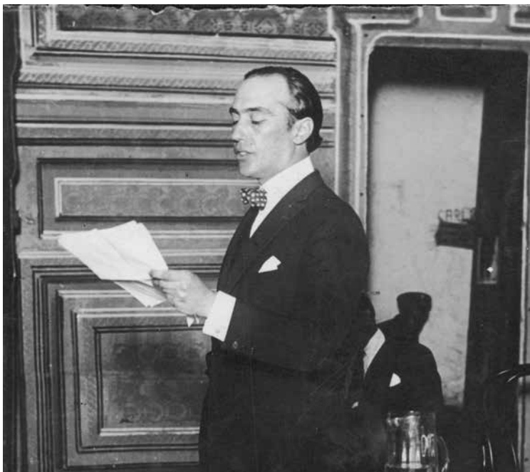
Imagen 1. Deodoro Roca, autor y redactor del Manifiesto Liminar , documento fundacional de la Reforma Universitaria de 1918, era graduado de la Facultad de Derecho de la Universidad Nacional de Córdoba.

Una de las características del movimiento reformista originado en Córdoba es que se extendió al resto de América Latina; esta es una de las cuestiones que me parece fundamental tener presente. Es, podría decir, uno de los pocos episodios transnacionales en el marco de una historia constreñida por los límites nacionales, porque la Reforma tras-