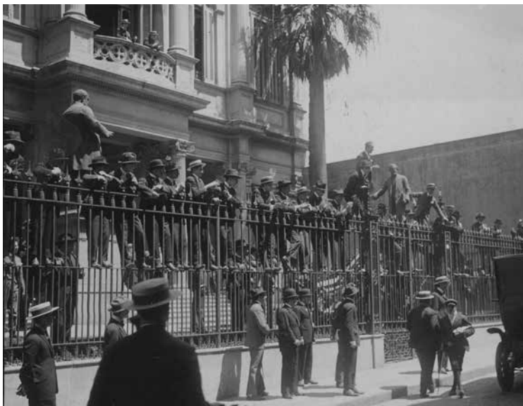
Imagen 3. Estudiantes tomando la Facultad de Derecho de la Universidad de Buenos Aires en 1919. En ese edificio de la calle Moreno, actualmente funciona el Museo Etnográfico Juan B. Ambrosetti, dependiente de la Facultad de Filosofía y Letras de la UBA.

En esa época había ya seis facultades en la UBA, pero el grueso de los estudiantes estudiaba Derecho y Medicina. Derecho fue, tradicionalmente, la facultad más conservadora tanto en la Universidad de Buenos Aires como en la de Córdoba. La Imagen 3 muestra una toma de la Facultad de Derecho en 1919. Podemos observar las características de los estudiantes, todos vestidos de una manera relativamente homogénea, lo que denota un sector social, y también se ve que era un universo fundamentalmente masculino.