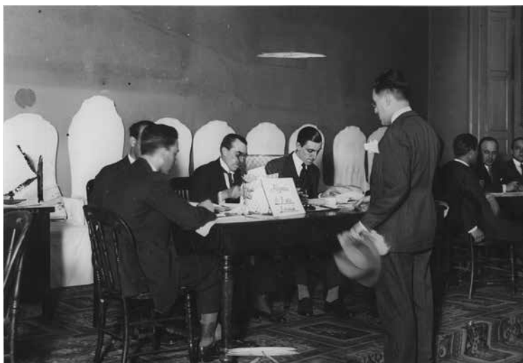
Imagen 4. En la Facultad de Ciencias Sociales tuvieron lugar las elecciones para designar los electores estudiantiles que han de integrar la asamblea que elegirá titulares ante el Consejo Superior Universitario. Triunfaron las listas de la Unión Reformista. Noviembre de 1925.