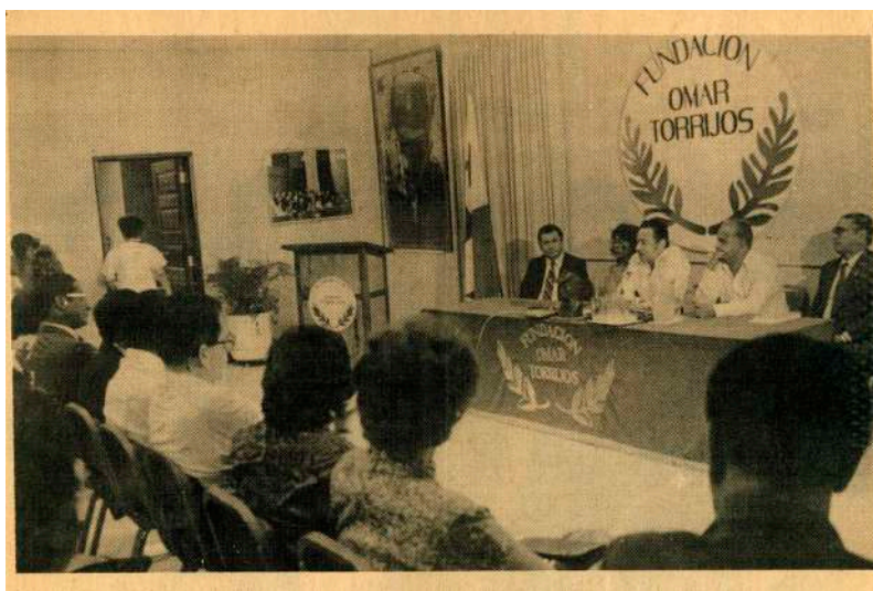
En la Fundación Omar Torrijos