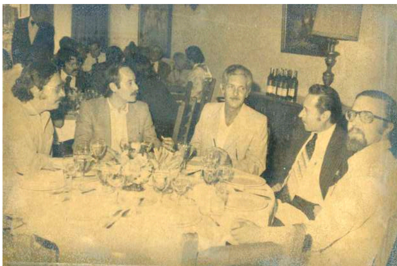
Compartiendo con unos amigos