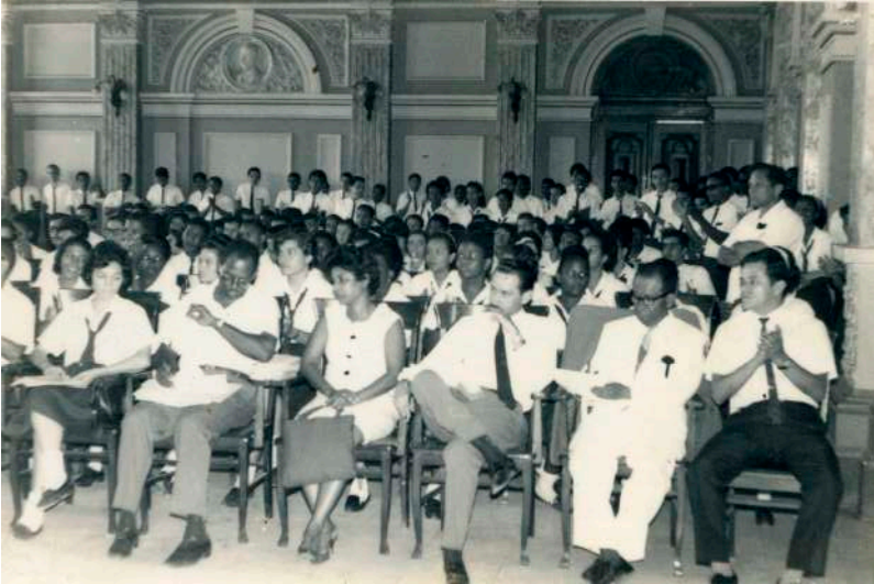
En el aula Máxima del Insituto Nacional