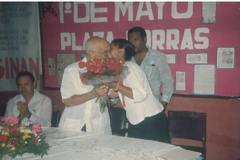
En Homenaje a Rogelio Sinán