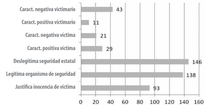
Gráfico 2. Funciones discursivas en cantidades totales

Aunque pareciera que existe una proporción similar a la legitimación de organismos y la deslegitimación de políticas públicas las funciones no son correlativas ni se implican. La legitimación del desempeño de organismos de seguridad tiene que ver con la presencia policial en algún momento del delito (durante o posterior a los hechos) y con el aporte de información; mientras la deslegitimación tiene que ver con la crítica de los programas estructurales diseñados por las instituciones públicas.