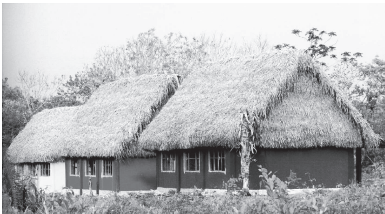
Imagen 1. Universidad Indígena Intercultural Ayuuk, Oaxaca, 2007-2008

Fuente: Bitácora Arquitectura , 2009, núm. 19. Recuperado de: http://www.revistas.unam.mx/index.php/bitacora/article/view/25114