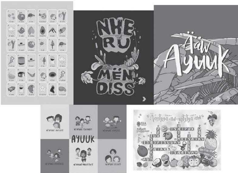
Imagen 2. Materiales didácticos producidos en el ISIA

Adicionalmente, el ISIA imparte talleres en lengua ayuuk con niños y adultos de nivel principiante, realiza relatorías de enseñanza-aprendizaje de la lengua ayuuk en diferentes variantes y niveles, además de contar recientemente con un programa de producción de material didáctico para la enseñanza y recuperación de las lenguas ayuuk, ombeayiüts y zapoteco.