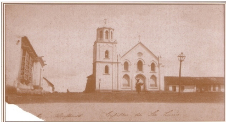
Imagen 1: Primera Iglesia de Santa Lucía en el Siglo XIX (1867-1881).

Fuente: Acervo Histórico del Estado Zulia (2013).