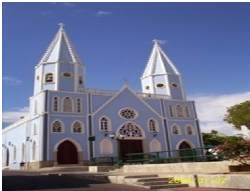
Imagen 2: Segundo Templo de Santa Lucía.