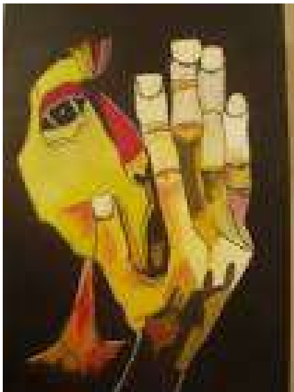
El Grito I. Guayasamín (1983).