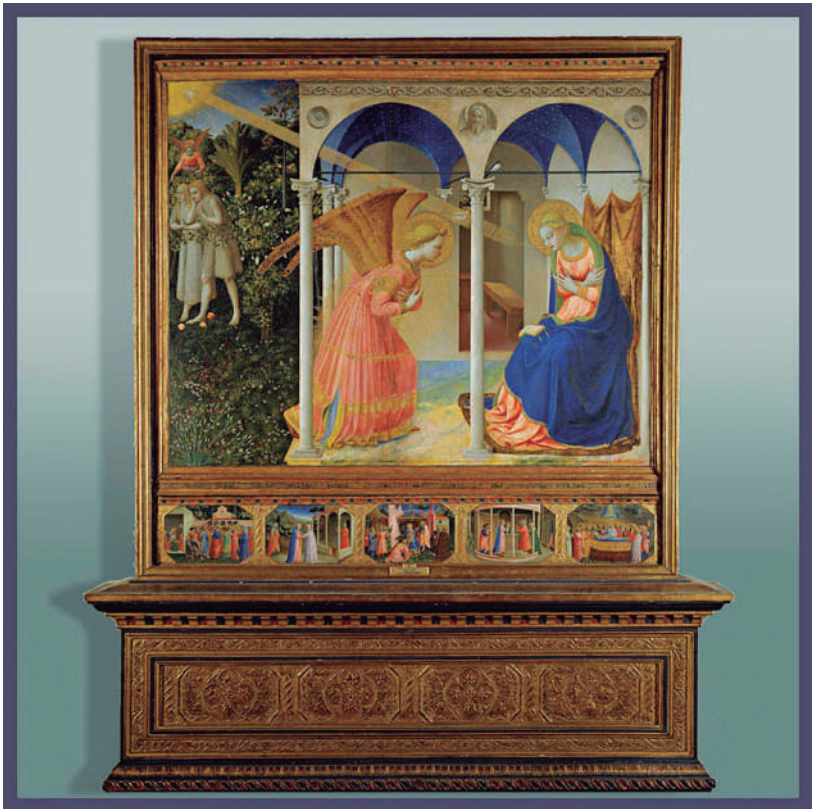
La Anunciación. s. XV. Guido di Pietro da Mugello (Fra Angélico)