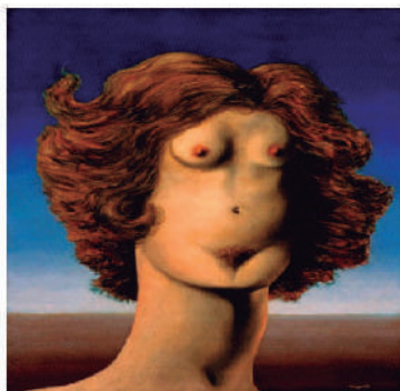
La Violación (1934) René Magritte

Definitivamente existe una brecha enorme en la representación estética de la mujer en su cotidianidad aun en nuestros días. Haciendo un paréntesis y pisando en su totalidad estas fechas, primer decenio del siglo XXI, ejercitando la contemporaneidad es necesario hacer una búsqueda sencilla en la red sobre las obras artísticas que representan a la mujer en su rol actual dentro de la sociedad y encontrar aún símbolos de consumo androcéntrico, mujeres que en sí, no reflejan la realidad social sino comercial de un producto sexuado, quizás dirigido a un consumidor que no se distingue mucho en su esencia del hombre dominante de hace más de cien años.