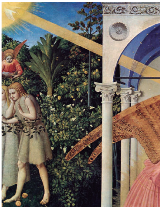
La Anunciación. s. XV. (Detalle) Guido di Pietro da Mugello (Fra Angélico) Fuente: Portal WEB Museo del Prado (2014)