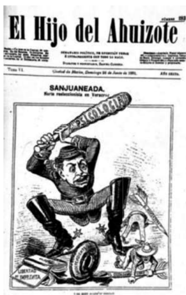
Imagen 1. El hijo del Ahuizote , junio 28, 1891, núm.283, Tomo VI, p. 1

1890. El hijo del Ahuizote 26 publicó en sus portadas los efectos represivos de esta antigua categoría filosófica y nueva categoría científica que, en cualquier caso, justificaba el sometimiento de la clase política sobre la población pobre e indígena (véanse las imágenes 1, 2 y 3). Así se entiende que para algunos se trató de un término científico que campeó en distintos escenarios de la vida pública como arma de control social (Revueltas Valle, 1990). La política porfirista contaba ahora con el garrote, machete o fuede de la psicología para ordenar la vida social.