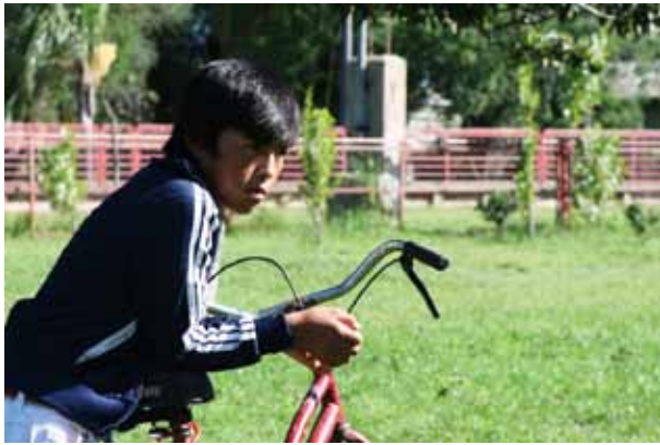
Fotografías de Lucas Ortiz del cortometraje documental "el imperio de los colores" - 2010