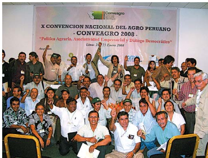
Una vez más, el agro peruano se reúne en una jornada nacional. Se viene la XI Conveagro.

Para la XI Conveagro se ha convocado delegaciones de gremios, organizaciones, Conveagro Regionales, Gobierno, Congreso de la República, cooperantes, Red Nacional de Periodistas Agrarios, Conveagro Juvenil e interesados.