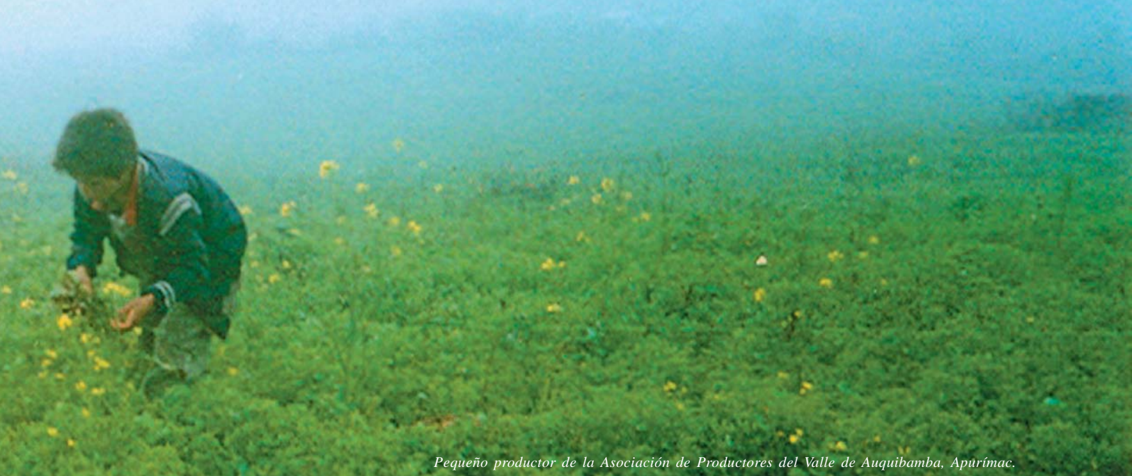
Pequeño productor de la Asociación de Productores del Valle de Auquibamba, Apurímac.