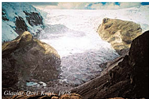
Glaciar Qori Kalis, 1978

Pero el retroceso de los glaciares no es el único impacto dramático del cambio climático en los Andes: una de las principales consecuencias es el desplazamiento hacia arriba de los rangos ecológicos altitudinales, es decir, que las condiciones ecológicas (temperatura, lluvias, etc.) que antes imperaban a determinada altitud, ahora se han desplazado a una altitud mayor. Este fenómeno compromete la subsistencia de algunas especies e incrementa la vulnerabilidad de los ecosistemas. Otras consecuencias son la variación de la extensión y ubicación de los pastizales, y la modificación de los flujos de agua de deshielo. Respecto a este último punto, el impacto del cambio climático está poniendo en riesgo la pro-