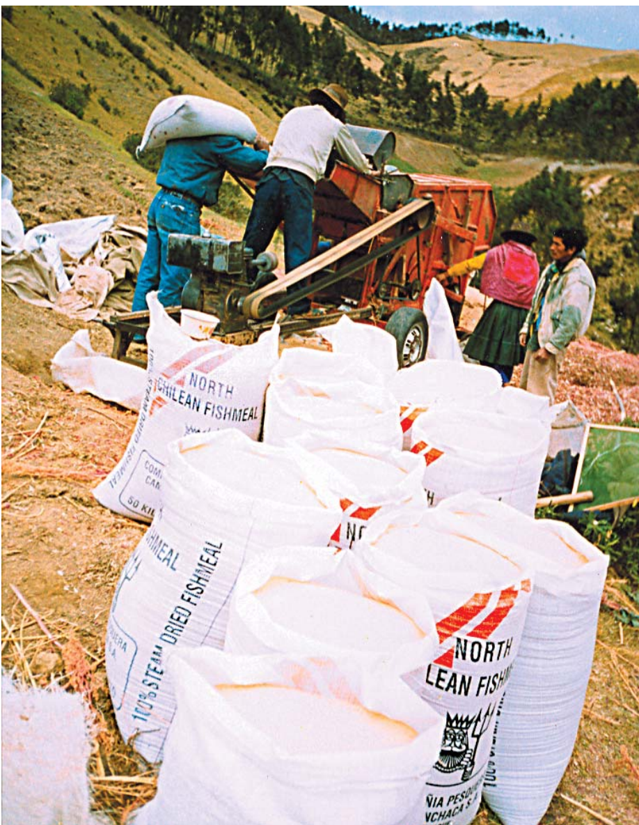
DIFICULTADES. Los productores de Auquibamba deben superar problemas como el descenso de la productividad de sus tierras.