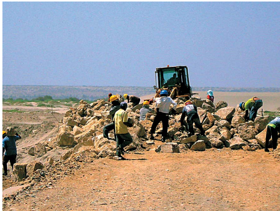
ACUERDO. Convenio entre comunidad de San Lucas de Colán y petrolera Olympic vincula incremento de la producción petrolera con pago a comunidad.

minución de la productividad de la tierra en los últimos años. «Al principio le vendíamos a Alisur ciento cincuenta toneladas por campaña. Pero en la última no hemos sacado ni cincuenta toneladas». El problema, según Hurtado, está