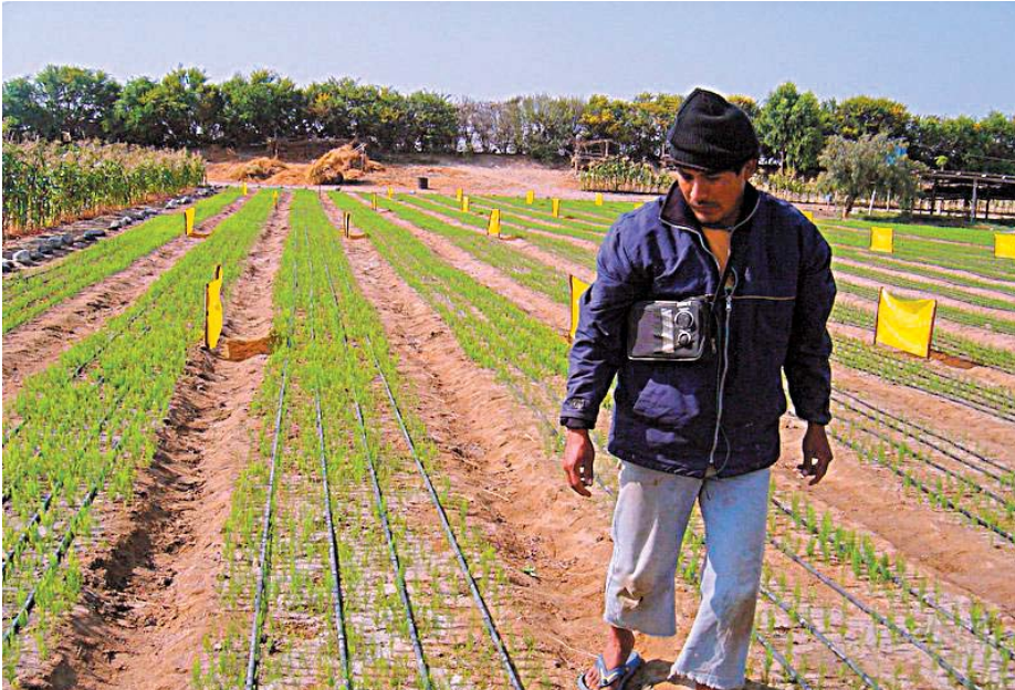
MEJORES PRECIOS. La Asociación de Productores del Valle de Auquibamba, en Apurímac, vende sus frijoles a la empresa Alisur, a mejores precios que a intermediarios.

Pero la parte interesante de los acuerdos logrados entre ambas partes es el vínculo legal que se ha establecido entre el incremento de la producción petrolífera y los pagos a la comunidad: cada vez que la empresa incrementa su producción en 200 barriles