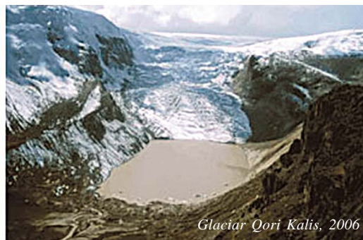
Glaciar Qori Kalis, 2006