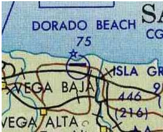
Según un mapa de la Fuerza Aérea de 1964