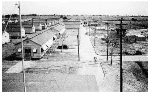
Barracas en 1941

Fue establecido en 1941 en el sur de Puerto Rico, en el municipio de Salinas por el cuerpo aéreo del Ejército. También se construyeron facilidades para el acuartelamiento de tropas. Cuando en 1942 ese personal fue trasladado a Gran Bretaña, las mismas fueron inactivadas y cerradas para operaciones aéreas.