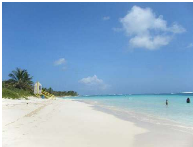
Playa de Flamenco en la actualidad

Desde 1939 la marina estadounidense utilizó gran parte de esta isla, particularmente el área de la Playa de Flamenco, como polígono de tiro para la práctica de bombardeos costeros y análisis de los resultados del lanzamiento de proyectiles. Esta actividad estaba coordinada desde la Estación Naval de Ceiba.