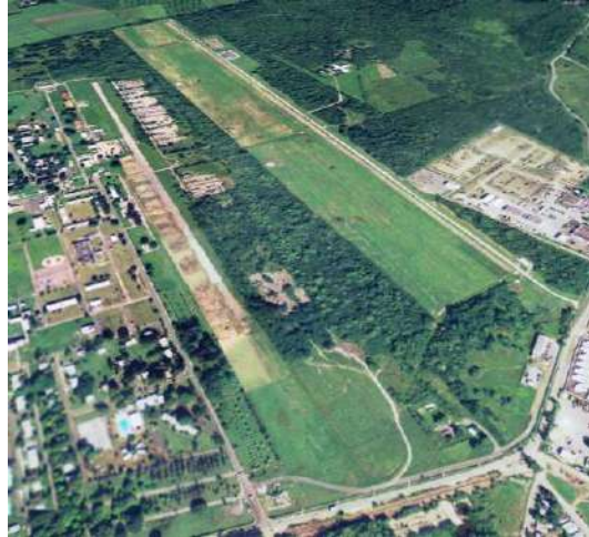
Pista del Fuerte Allen en 2004

Más tarde en la misma década la Marina estableció parte del sistema de radares, o sistema de antenas, ROTHER (más allá del horizonte) en Fort Allen. Ello tras la oposición de amplios sectores del pueblo puertorriqueño que rechazó la instalación de ese radar en el Valle de Lajas, la principal llanura no costera y reserva agrícola de Puerto Rico. Otra parte de las antenas está en Vieques.