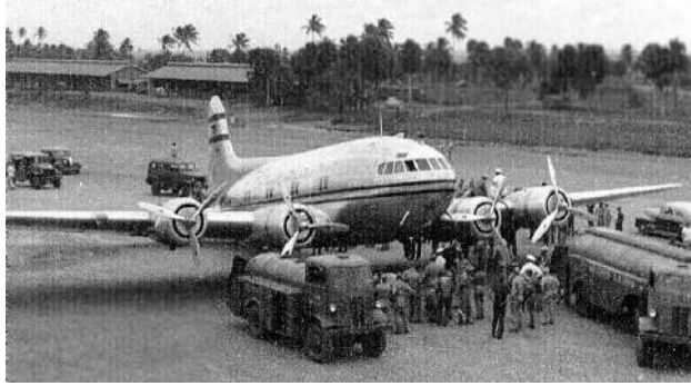
Fuerte Allen: Visita de un Boeing Stratoliner c. 1941

Fue establecido en 1941 en el sur de Puerto Rico, en el municipio de Salinas por el cuerpo aéreo del Ejército. También se construyeron facilidades para el acuartelamiento de tropas. Cuando en 1942 ese personal fue trasladado a Gran Bretaña, las mismas fueron inactivadas y cerradas para operaciones aéreas.