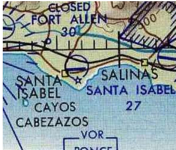
De un mapa de la Fuerza Aérea de 1964