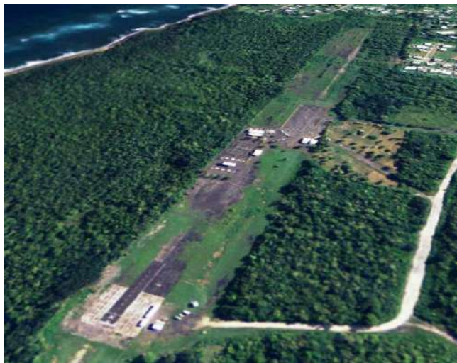
Foto aérea del 2004