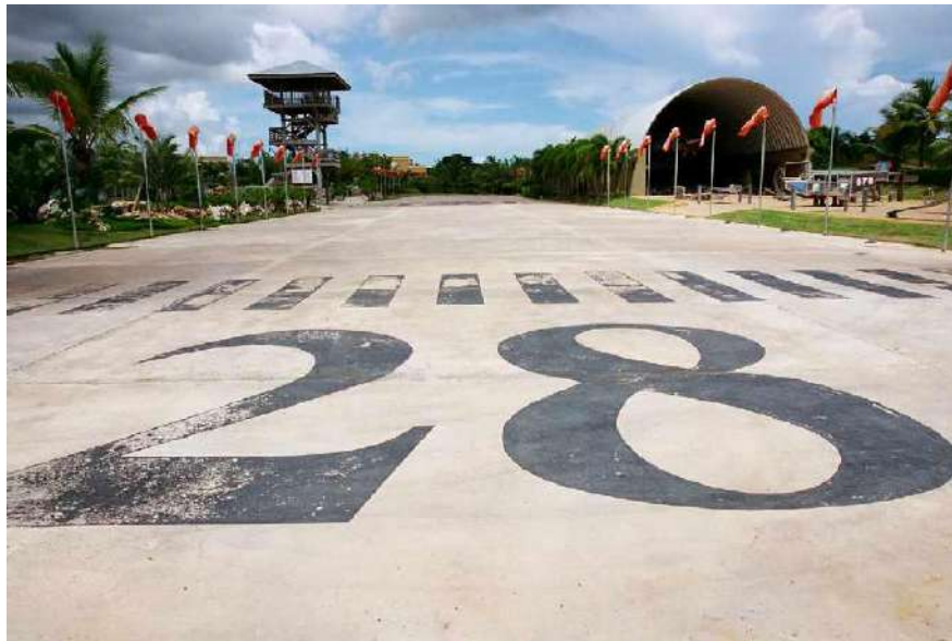
Aeropuerto de Dorado en 2003

quien la utilizó para desarrollar un complejo hotelero. Entonces, el aeropuerto se reabrió como instalación privada comercial a principios de la década de 1960 y estuvo operando hasta mediados de la década de 1980.