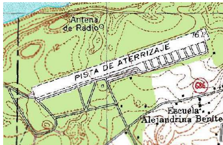
Mapa de 1977

Fue establecido en una finca de 554 acres que el gobierno estadounidense compró en 1941 en el noroeste municipio de Vega Baja. El Ejército construyó la pista y una serie de otras instalaciones. Sirvió como aeropuerto auxiliar de la Base Ramey y como centro de entrenamiento militar entre 1941 y 1956. Desde entonces y hasta 1975 fue utilizado como centro de entrenamiento por la Guardia Nacional; un año más tarde se traspasó la titularidad de esos terrenos y facilidades al Gobierno de Puerto Rico. Con el tiempo esta instalación se convirtió en un centro de práctica para aprendices de conductores de automóviles y área de entretenimiento y recreación para pilotos de modelos de avión.