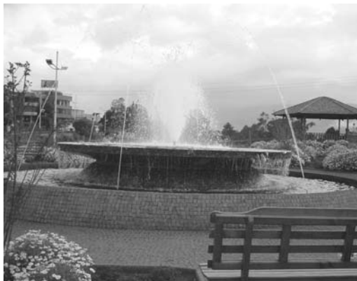
Parque lineal Machángara

Se refiere a la infraestructura y elementos tangibles. Debe contar con una fácil accesibilidad e iluminación. El diseño (tamaño, coherencia, ubicación) y la materialidad (elementos como árboles, asientos, faroles, ágoras, juegos infantiles, basureros) otorgan sentido y significado a los espacios, condicionan su uso y enriquecen el patrimonio arquitectónico y social de los barrios. Su diseño debe ir en correspondencia con los requisitos de las personas para un adecuado desarrollo de su vida social, ya que los espacios físicos no garantizan su uso de por sí.