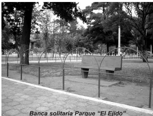
Banca solitaria Parque "El Ejido"

Debemos adaptar nuestra ciudad para la comunidad más no para los vehículos, privilegiando la movilidad y acceso a todos especialmente a niños, ancianos, discapacitados, etc.