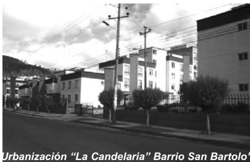
Urbanización “La Candelaria” Barrio San Bartolo

Por ello, consideramos que no son soluciones ni la privatización de los espacios, ni limitar la libre circulación. La mejor alternativa está en una recuperación real de espacios por parte de la comunidad, y dependencias municipales asumiendo el control de las situaciones mediante la ocupación de los espacios evitando su abandono. Estos lugares, en su planificación, deberán considerar iluminación adecuada, accesos amplios y vegetación que colabore con un mayor control visual.