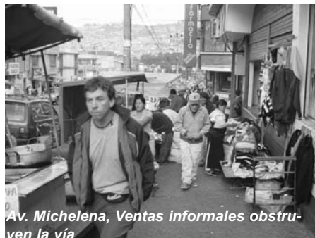
Av. Michelena, Ventas informales obstruyen la vía

Los vendedores formales e informales también han visto en el espacio público un sitio ideal para llegar a la gente con sus productos. Considerando el ancho reducido de muchas veredas por efecto de los cerramientos y las casetas de ventas, la ubicación de otros vendedores formales e informales obstruye aún más la circulación peatonal. El espacio debería estar distribuido de tal manera que tanto el peatón como el comerciante informal puedan ejercer sus derechos a la libre circulación y al trabajo, para una convivencia más armónica en la ciudad.