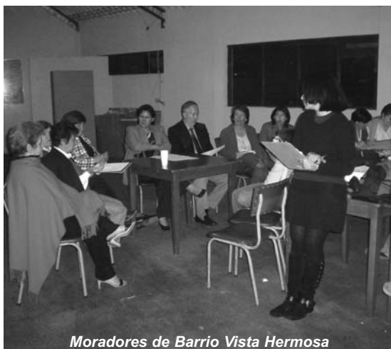
Moradores de Barrio Vista Hermosa

Por ello, las acciones en las que se busque la integración a la comunidad deben incluir la participación de estos “grandes” actores. Los niños son alejados cada vez más de los espacios donde pueden conocer otras personas y compartir juegos, espacios, sueños, imaginación. Si los parques son apropiados se convierten en espacios seguros donde los niños pueden aprender mucho más mediante la interrelación con otros como ellos.