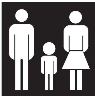
Fig. 2: Familia. Área Social de la Plataforma para un Tiempo Radical (LVI, 4-09-1983, suplemento).