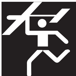
Fig. 1: Juventud. Área Social de la Plataforma para un Tiempo Radical (LVI, 4-09-1983, suplemento).

Semanas después de publicar la Plataforma se concretaba el Acto de proclamación de la UCR en la plaza Vélez Sarsfield de Córdoba con un público que sumaba 90.000 personas. En ese evento los jóvenes adquirieron una visibilidad destacada en tanto componentes de esa