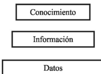
Fig. 1. Pirámide informativa.

Las figuras deberán estar posicionadas de forma adecuada para su lectura en el texto, de manera centrada, usando Arial 10 pto y con encabezamientos en negrita, por ejemplo: