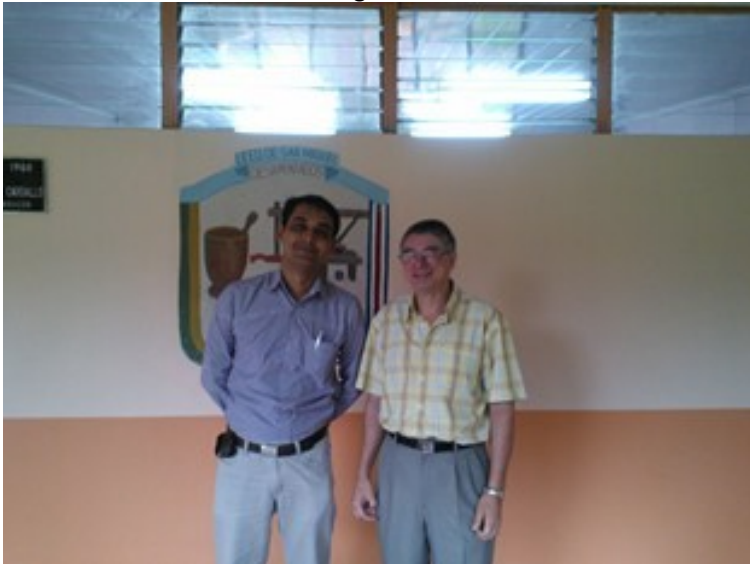
Imagen N° 8

Liceo San Miguel de Desamparados