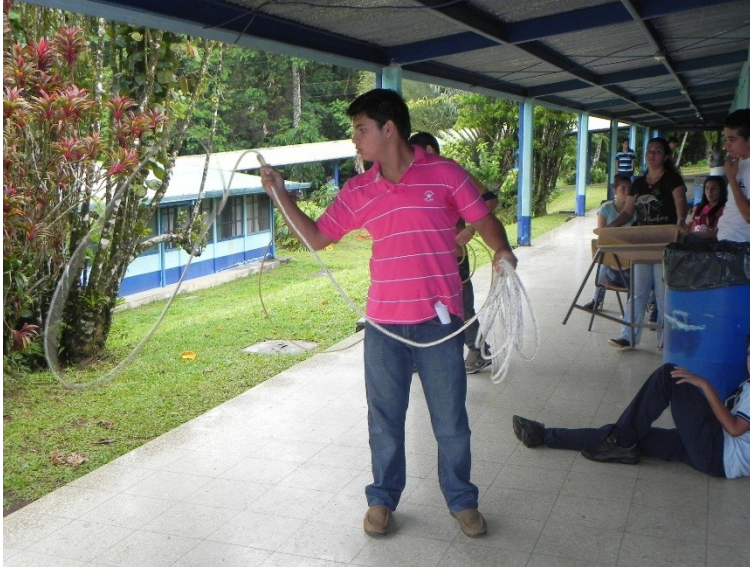
Imagen N° 6

Fuente: propia, 2011. Liceo Innovaciones Educativas La Virgen