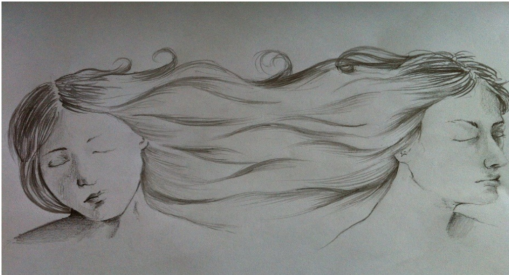
Figura N° 1. Dicotomía migrante

Fuente: Dibujo en grafito de Vanessa Gómez.