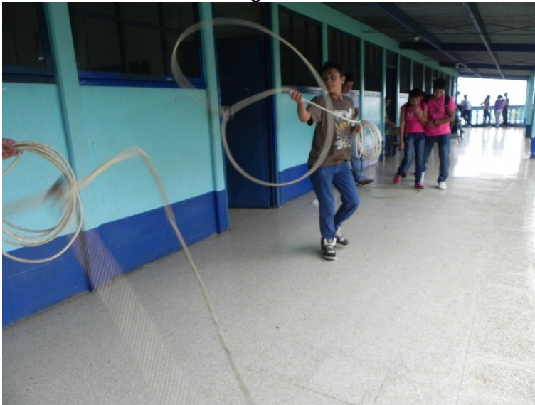
Imagen N° 7

Fuente: Propia, 2011. Liceo Innovaciones Educativas La Virgen