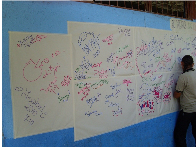
Imagen N° 5

Leer críticamente el mundo es un hacer político-pedagógico; es inseparable del pedagógico-político, es decir, de la acción política que involucra la organización de grupos y de clases populares para intervenir en la reinención de la sociedad.