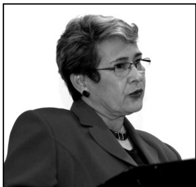
YAMILETH GONZÁLEZ GARCÍA, RECTORA DE LA UCR

Discurso pronunciado en la inauguración de la Exposición “La presencia de las mujeres en el Arte” el 24 de agosto 2009 en el marco del X Aniversario del CIEM.