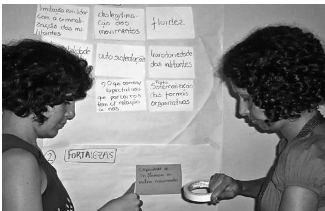
Compañeras de la Marcha Mundial de las Mujeres durante uno de los talleres

a ser enfrentados en todos los niveles de la organización, en relación a los procesos de formación y el fortalecimiento de liderazgos: “esfuerzo especial necesario para la formación de jóvenes: el proceso de formación debe permitir el relevo de las generaciones. Hay que formar cuadros nuevos, jóvenes [...] Situación de las mujeres: hay mucha disparidad entre hombres y mujeres. Las mujeres tienen varias tareas y tienen dificultad de participar, especialmente mujeres jóvenes. Los métodos de formación lo deben tomar en cuenta. La información debe llegar a las mujeres, debemos facilitar su integración en la organización” (LVC, 2009:192).