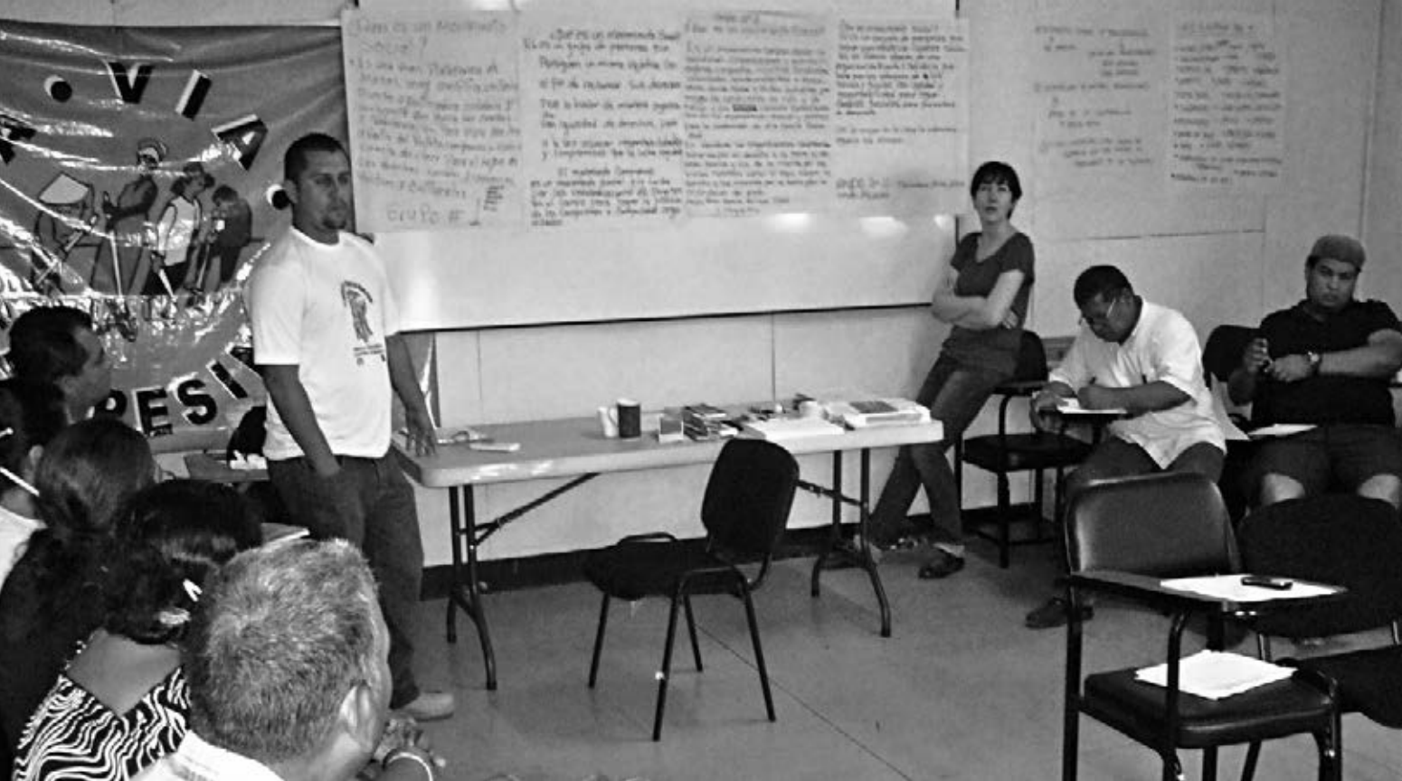
Plenaria durante el Taller realizado con 24 militantes de Vía Campesina-Honduras (Tegucigalpa, 2012)

con lo estructural. Abriendo, por tanto, a que las relaciones personales y afectivas (en la casa, en la comunidad, en el empleo, en las organizaciones,...) sean parte de lo político y foco de atención para construir prácticas emancipadoras.