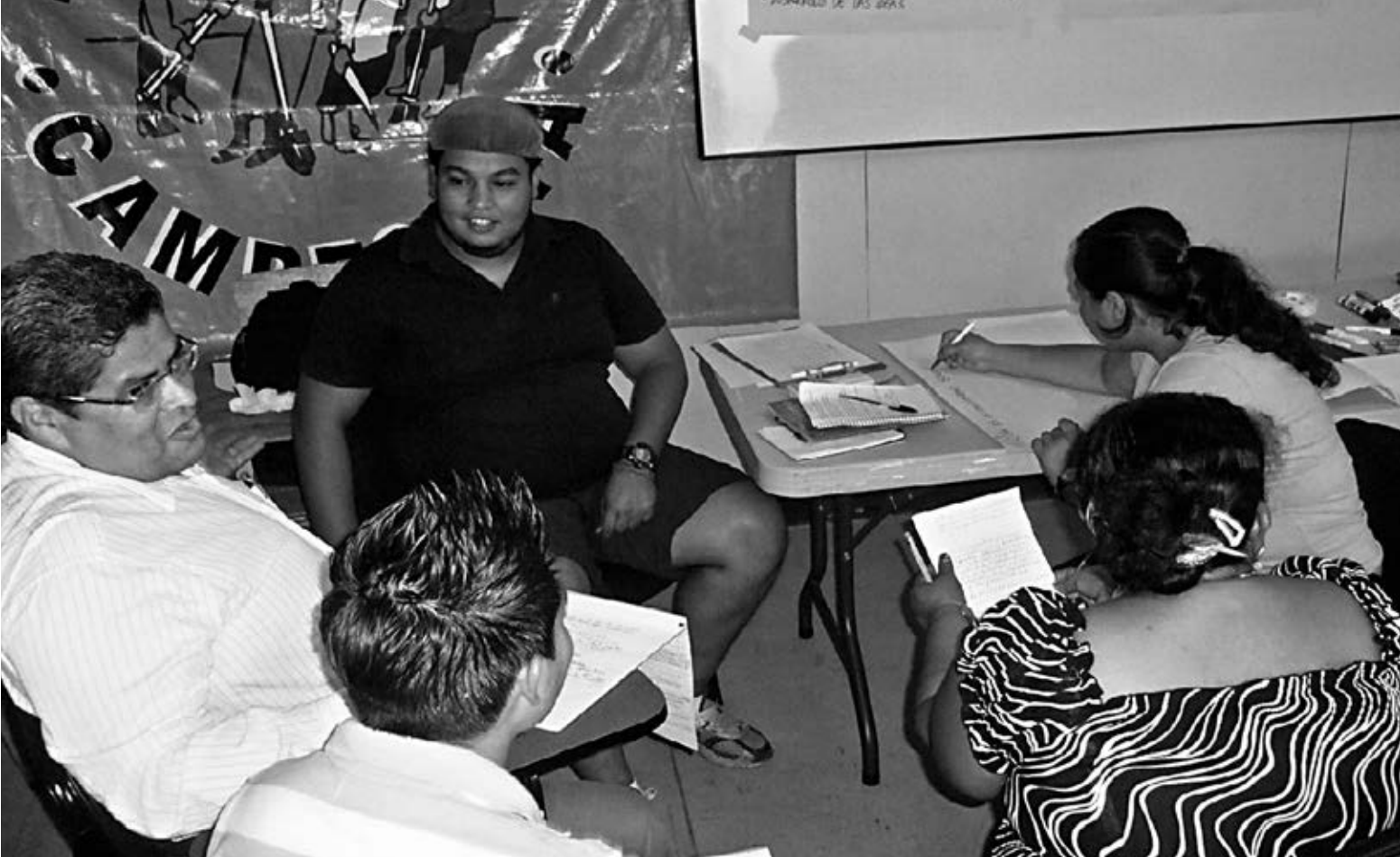
Trabajo en grupos durante el Taller realizado con 24 militantes de Vía Campesina-Honduras

2) Expresan, por ello, mediante su capacidad creativa de denuncias, mensajes, discursos y esquemas cognitivos, una serie de demandas y necesidades colectivas de interés general. Y lo hacen desde una lógica política de conflicto, señalando responsabilidades políticas e identificando adversarios a través de prácticas de movilización en ocasiones confrontativas y transgresoras. Lo cual suele generar respuestas represivas por parte del sistema jurídico-político institucionalizado, ya que aunque no suelen pretender la toma del poder político institucionalizado, sí buscan la transformación de las relaciones de poder en la sociedad en su conjunto.