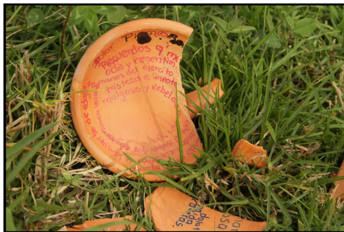
Taller Duitama, Proyecto Voces de la memoria.

Esa relación estrecha entre memoria y poder es una razón más para que el presente proyecto deba mirar con atención la opinión de las personas. Porque la lucha por el poder no se libra solamente en el ámbito político. Toda la cultura, en sus diversas subculturas, está atravesada por esa lucha de poder, en la que la reconstrucción de la historia hace parte de la narrativa fundacional, que el mismo Le Goff describe en los términos siguientes: “Apoderarse de la memoria y del olvido es una de