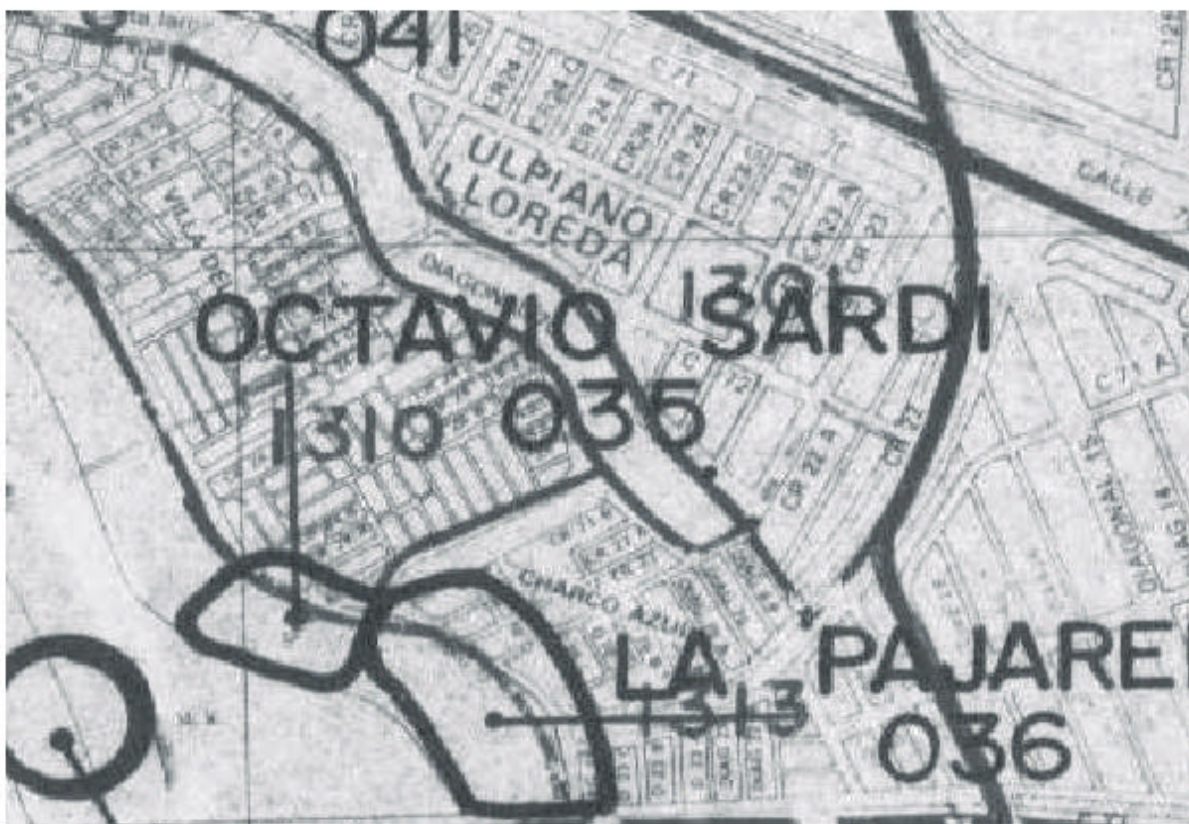
Mapa 2: Localización cartográfica de Sardi y Charco Azul.