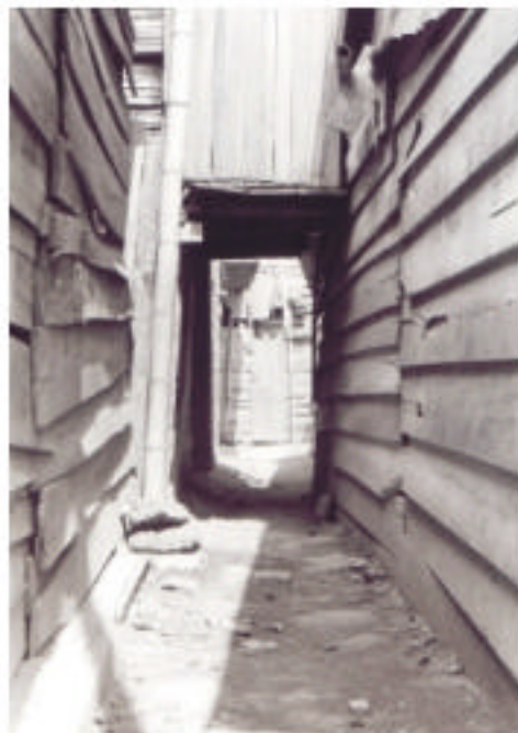
Vista desde lo alto de Sardi, Charco Azul y Villa del Lago. Callejón en Charco Azul, callejón en Sardi.