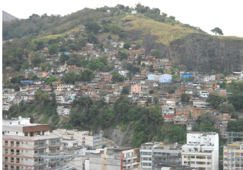
Figura 1 - Vista do Morro da Azaléia (Janeiro de 2012).

O principal interesse de minhas visitas era, evidentemente, o interesse inerente à pesquisa a qual eu representava, intitulada “Cotidiano de Crianças Pequenas em Favelas do Rio de Janeiro e do Recife”. Este interesse, a despeito do título, estava relacionado à investigação sobre a violência no cotidiano de crianças e moradores das comunidades. Mais do que mapear o que era geral, era de nosso interesse compreender o que havia de específico a cada local e a cada grupo, permeando o cotidiano como forma de acesso às interpretações mundanas acerca da violência na família, na comunidade e nas instituições.