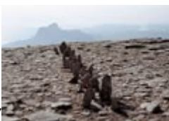
A line made by walking, 1967