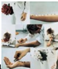
Death control, 1974