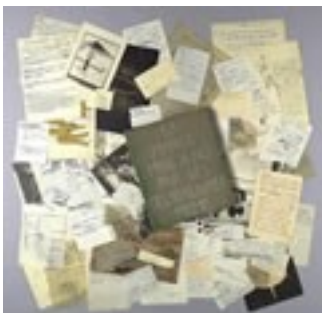
Duchamp: Caixa Verde (1934)