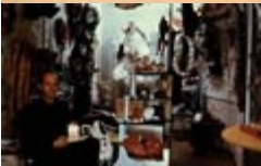
Claes Oldenburg: A loja (1961)