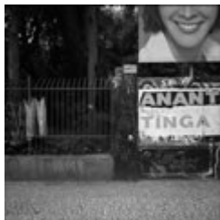
(1983-presente) Avenida Paulista