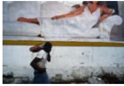
(1979-2008) Outdoor Mulher