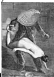
Ernst: Une semaine de bonté (1934)