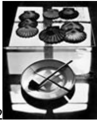
Stilleben mit Pfeife, 1958

Em sua segunda manifestação sobre as possibilidades criativas na fotografia, ele enfatiza alguns elementos e condições para a criação de imagens, mas pondera que essa intenção não deve ser levada como formato de classificação nem de receituário. Para ele, como pensador moderno, o plano tecnológico era relevante no processo da imagem, que poderia ser utilizado de acordo com a capacidade técnica de cada um e, através dos elementos da Gestaltung aplicados à fotografia, era elaborada e analisada a imagem. Esses fatores eram condicionantes recíprocas e em relação à Fotogestaltung , onde, resumidamente, diferenciase: