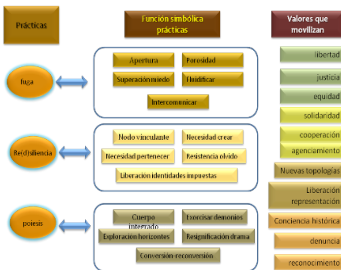
Gráfica 4. La función Simbólica de las prácticas de los Niños, Niñas y Jóvenes en Situación de Calle

Autor: Granada P. Alvarado S.V. Tesis Doctoral: la Resiliencia en la Nuda vida: el Homo Sacer como sujeto político, 2009. Doctorado en Ciencias sociales Niñez y Juventud, CINDE-Universidad de Manizales.