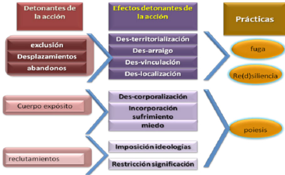
Gráfica 3. Detonantes de la acción y prácticas detonadas.

Autor: Granada P. Alvarado S.V. Tesis Doctoral: la Resiliencia en la Nuda vida: el Homo Sacer como sujeto político, 2009. Doctorado en Ciencias sociales Niñez y Juventud, CINDE-Universidad de Manizales.