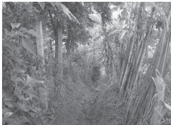
Figuras 4 e 5. “Pinguela” e trilha percorridas para chegar a uma das entradas do bairro Buieié após o ponto final do ônibus. Autor: Lucas Magno, 2006.

Para análise da infraestrutura do Buieié considerou-se os aspectos relativos ao acesso que os moradores têm aos serviços públicos básicos: água tratada, destino final do lixo, serviço de captação do esgoto, energia elétrica, escolas, serviços de saúde e lazer.