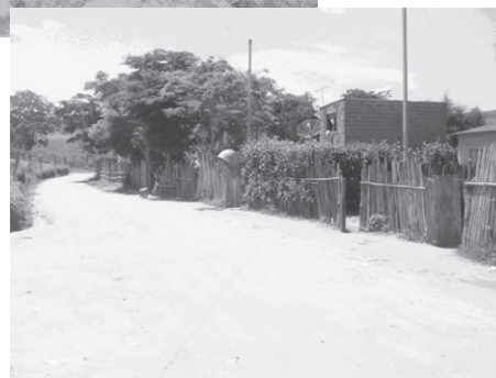
Figuras 2 e 3. Casas de “pau a pique” e barreadas ainda presentes no Joãozinho (parte alta do bairro) e casas de alvenaria próximas a um telefone público no “Buieié de baixo”.