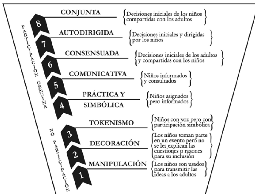
Figura 7. Niveles de participación

quieren tomar parte en una investigación, en qué grado y de qué manera. Al respecto Hart (1992), propone 8 niveles de participación de los niños y niñas, representados en el siguiente gráfico: