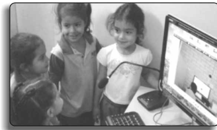
Figura 3. Fotografía tomada por un miembro del equipo de investigación, mientras las niñas interpretaban una fotografía tomada por una de ellas

Al tratarse de niños o niñas pequeños, es necesario garantizar que reconozcan la fotografía como parte de su cotidianidad, esto es, que identifiquen los elementos familiares, y poco a poco introducir preguntas de acuerdo con su nivel de desarrollo, por ejemplo: preguntar por las cosas