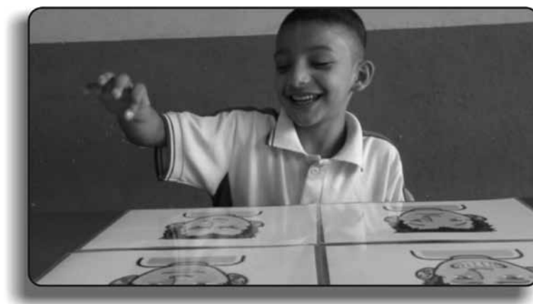
Figura 6. Fotografía registrada por una de las cámaras de un circuito cerrado de televisión, mientras el niño respondía un cuestionario.

En esta investigación los cuestionarios fueron una estrategia muy útil para recolectar datos y establecer algunas comparaciones frente a las actitudes de los niños y niñas antes y después de la experiencia; no obstante, son pocos los estudios en los que se emplean; para Einarsdotti (2007) los cuestionarios no son una estrategia común en la investigación con los más pequeños y pequeñas.