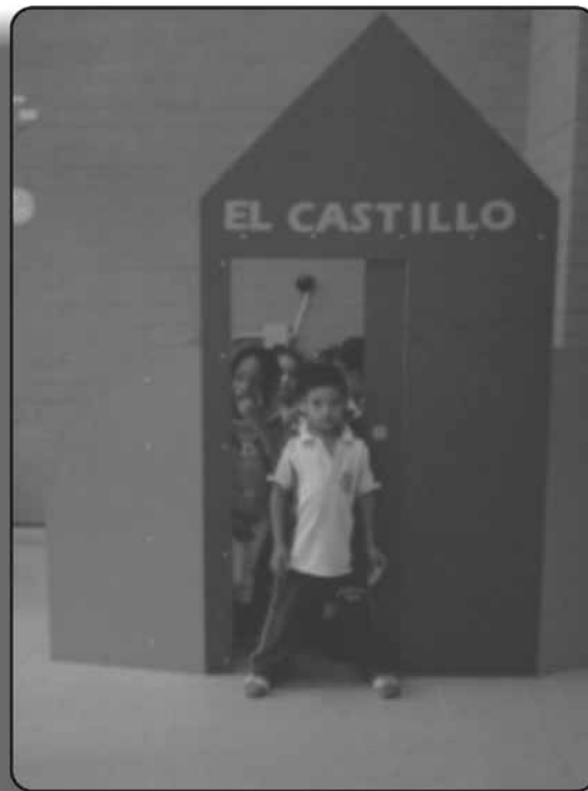
Figura 5. Fotografía tomada por un niño de 5 años y 4 meses

así, cada fotografía en esencia fue original y pudo ser interpretada por cada niño y por cada niña de acuerdo con las razones que tuvo para tomarla.