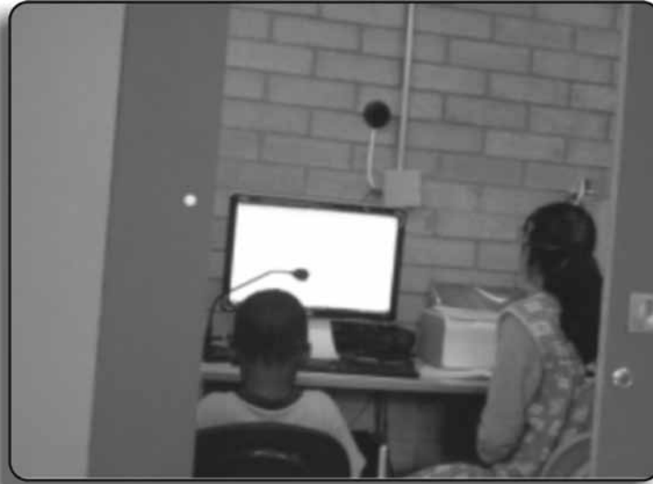
Figura 4. Fotografía tomada por una niña de 4 años y 2 meses

Al usar las fotografías se permitió a los niños y niñas elegir, además, evitar el deseo de copiar de muestra de sus demás compañeros y compañeras;