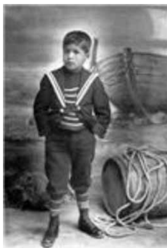
Figura 5: Niño