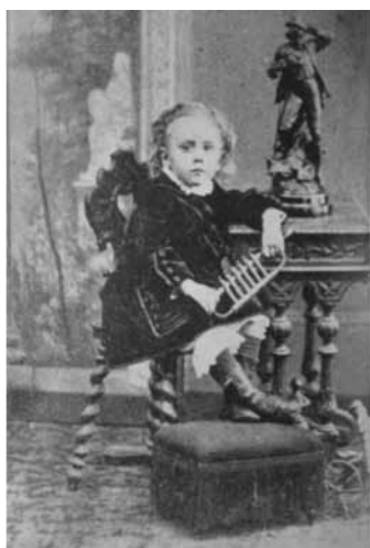
Figura 3: Varón