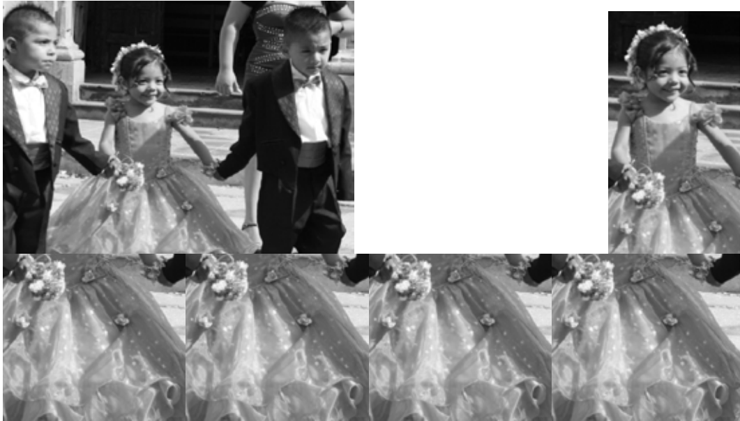
Figura 1: Detalles de una niña al templo

Fuente: Fotografía de Héctor Serrano B. (Yautepec, Morelos, enero 2010).