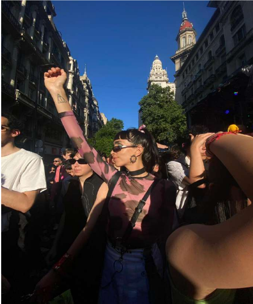
Marcha del orgullo LGBTIQ+ del 1 de noviembre de 2025, en Buenos Aires.

La experiencia argentina ilustra otra faceta de esta ofensiva contra las políticas de diversidad bajo la presidencia de Javier Milei (2023-2027). En diciembre de 2023, apenas asumido, comenzó el desmantelamiento institucional disolviendo la Subsecretaría de Políticas de Igualdad y Diversidad y pocos meses después, en 2024, avanzó con la eliminación del Instituto Nacional contra la Discriminación, Xenofobia y el Racismo (INADI). La embestida continuó en 2025 con la supresión de trece programas de género y diversidad, que garantizaban derechos fundamentales como educación, inclusión laboral y salud reproductiva. Todo ello acompañado por una retórica oficial hostil: declaraciones públicas contra los movimientos feministas y disidentes; el anuncio de la eliminación de la categoría “x” en los documentos de identidad, reconocida en 2021, para reafirmar que el Estado sólo reconocería dos géneros, hombre y mujer; e incluso la intención de reabrir la discusión sobre la Ley 26.743 de Identidad de Género , considerada desde su sanción en 2012 como una de las conquistas más paradigmáticas de la comunidad trans a nivel mundial.