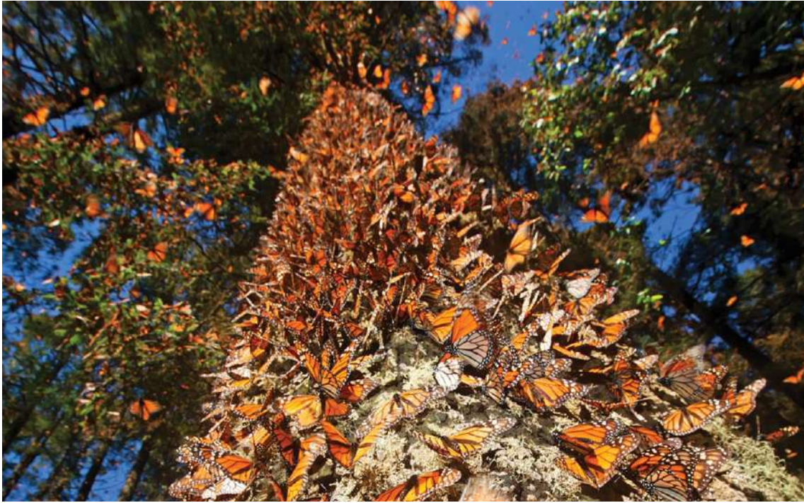
Conglomeración de mariposas monarca.

Según el artículo 27 en su párrafo tercero de la Constitución Mexicana , la Nación tiene el derecho de imponer a la propiedad privada las modalidades necesarias para el interés público y de regular el uso de los recursos naturales, buscando distribución equitativa, conservación ambiental y mejora de condiciones de vida. Asimismo, el artículo 9 de la Ley Agraria establece que los núcleos ejidales tienen personalidad jurídica, patrimonio propio y son propietarios de las tierras que les han sido dotadas o de las que hubieren adquirido por cualquier otro título. El mismo artículo 27, en su fracción VII , reconoce la personalidad jurídica de los ejidos y protege su propiedad, tanto para el asentamiento humano como para actividades productivas.