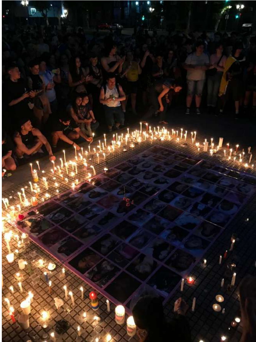
Movilización en conmemoración del día de la memoria trans, el 20 de noviembre de 2025 en Buenos Aires.

He aquí que ser marica en América Latina significa una verdadera revolución. Esto porque, como sugiere Pastor (2024), mientras las identificaciones propias de las políticas públicas modernas, que poco han podido soltar de la colonialidad, producen identidades individuales caracterizadas por la relativa ausencia de voz y cuerpo, las disidencias habilitan la apertura hacia subjetividades políticas, que toman la palabra y ponen el cuerpo a partir de la inclusión en, y la afirmación de un “nosotres” (subjetividades políticas colectivas).