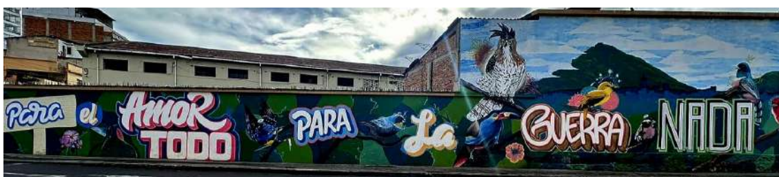
Mural "Para el amor todo, para la guerra nada", en homenaje a las víctimas del conflicto social y armado en Samaniego (Nariño), ubicado en la calle 19 de la ciudad de Pasto, Colombia.

Y bueno, desde la Agencia, en toda esa discusión, estamos involucrando jóvenes. Algo que no se había hecho antes. Tal vez no es suficiente, pero los jóvenes están teniendo ahí un eco, un papel, un lugar, su liderazgo, su voz y todo lo demás. Es importante que en estos lugares se pueda reconocer también ese valor para el avance de la transformación social y la transformación de la realidad que, en últimas, es lo que conecta, a los jóvenes, sea para un lado, o para el otro; que pese a ese inconformismo encontremos un sentido político porque no puede ser para cualquier lado. Colaboremos con la democracia, con la justicia, colaboremos en cuidar la vida para que puedan avanzar los derechos.