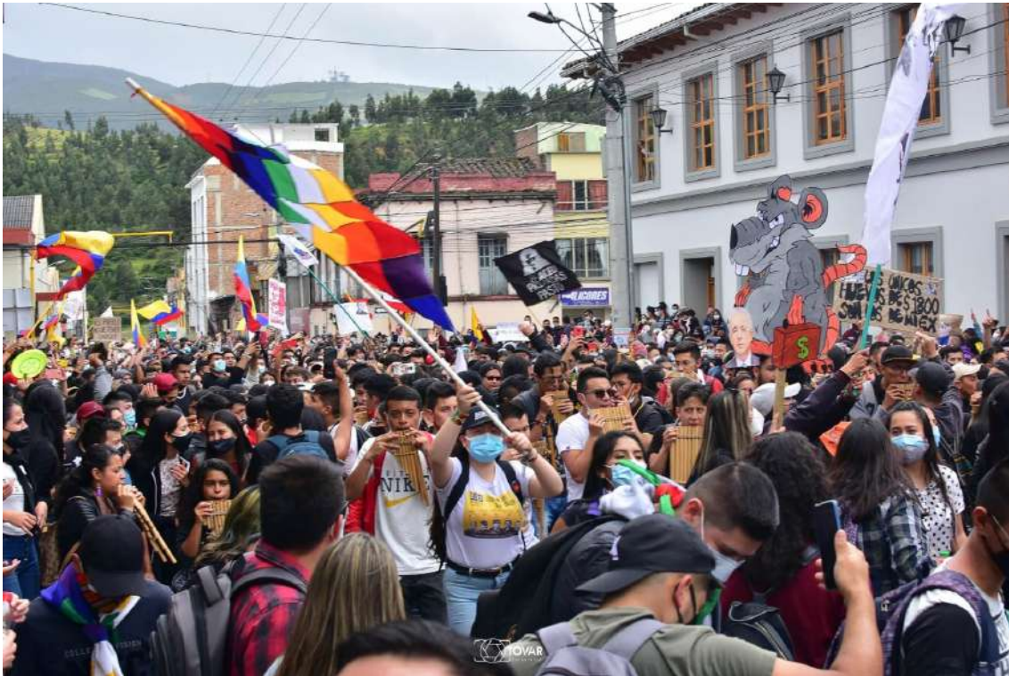
Fotografía de la participación juvenil durante las movilizaciones del Estallido Social en Colombia, 2021.

directamente en la ineficacia de las políticas, en las dificultades desde el diálogo de la juventud.