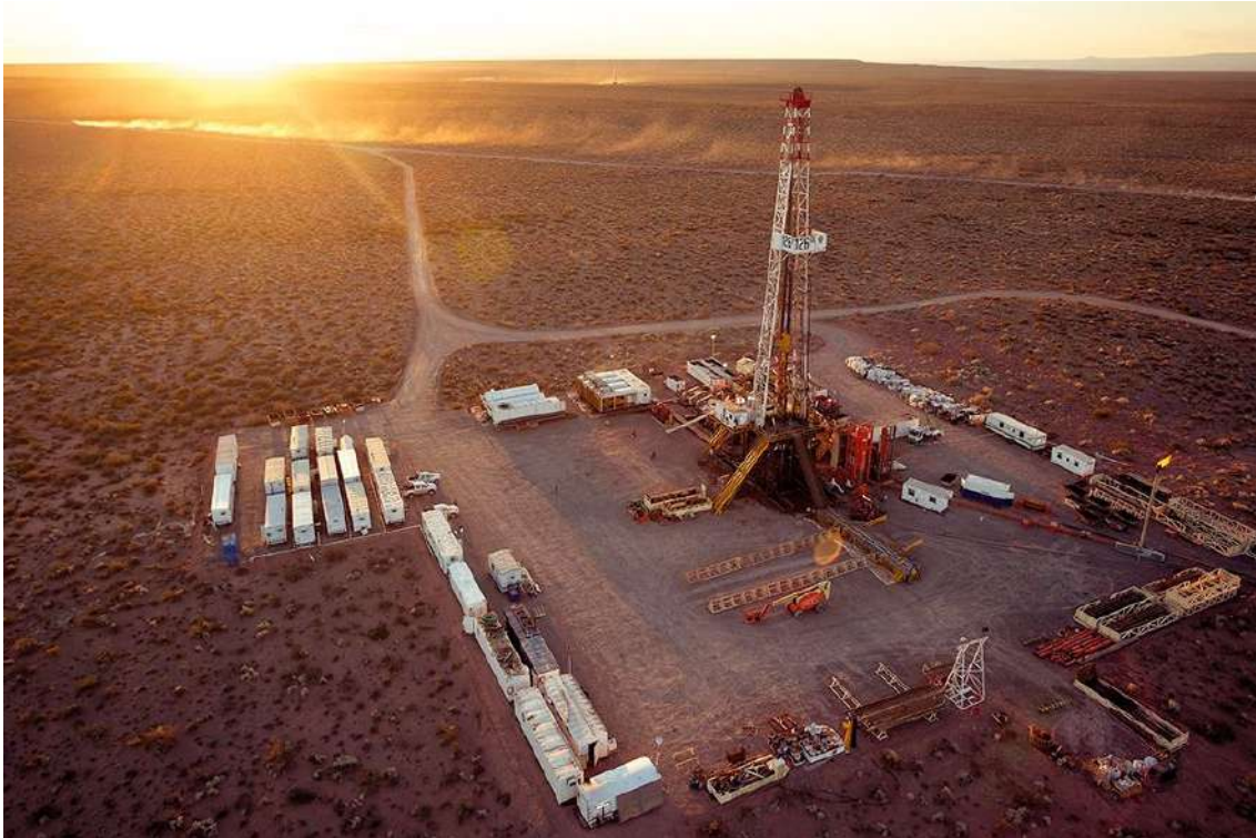
La instalación de perforación en la formación Vaca Muerta en la provincia de Neuquén (Argentina), reserva de gas y petróleo no convencional. Fuente: Secretaría de Energía de Argentina.