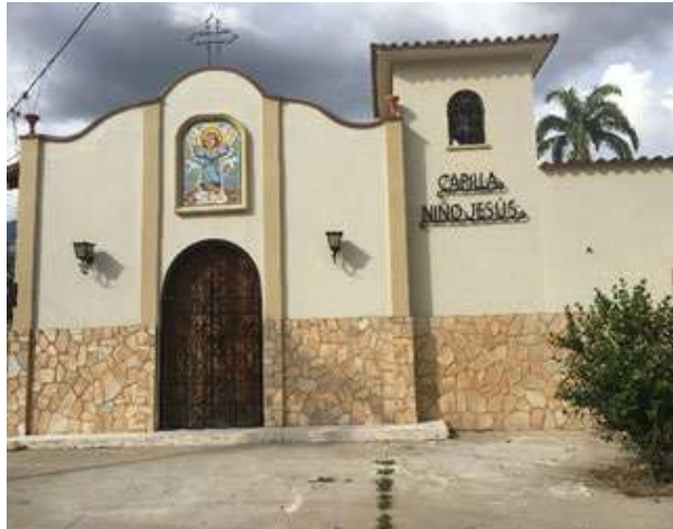
Fig. 2. Capilla del Niño Jesús (El Limón, estado Aragua)

Las pastorcillas (promeseros disfrazados de mujer) se maquillan; los pastores van haciendo los últimos ajustes a los trajes (sombrero adornado con correa) y prueban su instrumento percusivo de acompañamiento (el gajillo). Luego de cantar los aguinaldos al Niño Jesús, emprenden su recorrido bailando la imagen desde la avenida Caracas hasta llegar a la calle Niño Jesús y, finalmente, se establecen al frente de la iglesia. Los pastores y pastorcillas forman filas paralelas en parejas, los músicos se ubican delante de estas filas, conjuntamente con las andas del niño y el titirijí. El viejo y la vieja van detrás de las filas y el cachero, adelante, en medio de las dos filas.