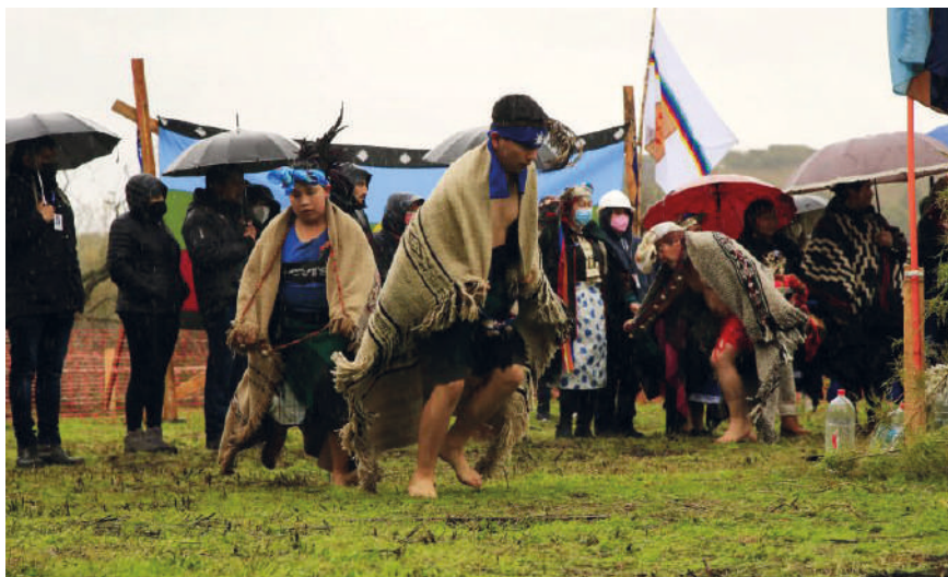
Figura 8. Ritual ancestral del pueblo Mapuche bendiciendo terreno donde se construirá un hospital.

Los enfermos mapuches, generalmente, recurren a ambas opciones al momento de construir un patrón de comportamiento de atención de la salud, en un constante ir y venir entre las consultas médicas en el hospital y — simultáneamente o alternativamente— a las curanderas indígenas. Y aquí es apropiado remarcar que, para ellos, desde la salud y la enfermedad, el «otro» es el profesional, académico y autoridad en tema de enfermedades por sus competencias y pertinencias profesionales. «En el caso de la medicina mapuche, la figura del “shamán” fue, sin duda, la que dominó el campo de la cura. En la actualidad, la “machi” es menos accesible al observador externo y es probable que actúe como un término que resume muy diferentes formas tradicionales de cura» (Kalinsky y Arrúe, 1996:169).