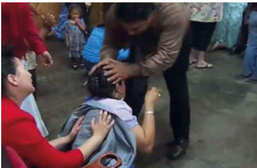
Figura 11. La sanación es solo cuestión de fe. Fotografía extraída de https://editoriallapaz.org/images-default-folder/oo-exorcismo-pentecostal-mujer-grande.jpg Fecha de última consulta 20 de Julio de 2023.

El discurso y los saberes médicos deben tener cuidado en estos contextos interculturales de no caer en la trampa de ser catalogados como dogmas. El médico en tanto poseedor de un cuerpo de saberes y conocimientos puede asimilarse a cualquier proceso de sobre-hegemonización e imponerse y volverse última y única doctrina. Lo deseable es que vaya en otras direcciones y «pueda sacar partido del “puzzle” de creencias, incluidas las propias, y en vez de ir descartando o aceptando, poniéndose en lugar de fiscal moral, deja que sean las personas quienes tomen la delantera, produciendo todos juntos las ventajas terapéuticas» (Kalinsky y Arrúe, 1996:182), que ayuden a la persona enferma a recuperarse.