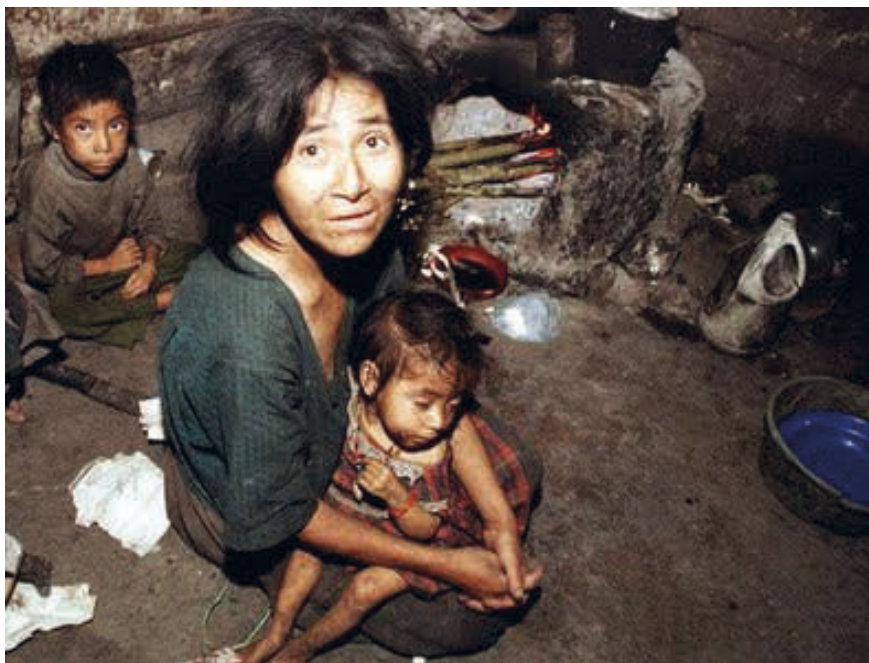
Figura 4. Condiciones de vida de las comunidades aborígenes del norte de Salta. Fotografía extraída de http://nomaschicosconhambre.blogspot.com/2011/02/la-comunidad-aborigen-wichi-pierde.html Fecha de última consulta 6 de Julio 2023.

Según las presiones y dificultades que el gobierno de turno debe enfrentar con el devenir de este brote de cólera, la «cultura» va tomando diferentes valoraciones: es pobreza y marginalidad a la que están sometidos estos grupos de indígenas, producto de razones históricas alejadas del presente. Luego esa «pobreza» se sitúa y acentúa por la fuerza de sus hábitos, creencias y costumbres ancestrales, que impiden que se incorporen a la vida moderna. Por lo que podemos observar que la «culpa» de las condiciones que conllevan al brote de cólera se debe pura y exclusivamente a sus hábitos y condiciones de vida que toman por elección y bajo su única responsabilidad, nada tiene que ver aquí el Estado como garante de condiciones de vida digna para sus habitantes. Al respecto el Gobernador de la provincia de Salta en 1992 declara a un reconocido diario: