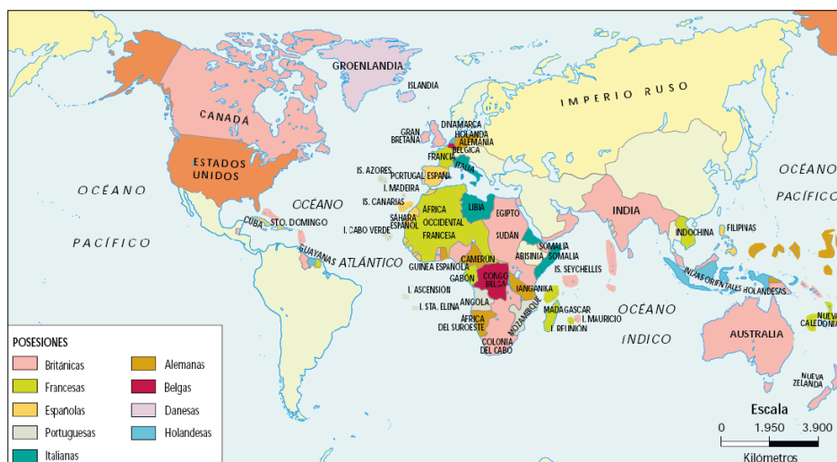
Figura 1. Imperios coloniales.

Se trata de sociedades sometidas a presiones externas y a las más activas fuerzas de cambio. Como ciencia específica, la antropología social, cultural y etnológica 2 aparece recortando un sector particular: el de grupos étnicos y socioculturales no europeos y posteriormente no desarrollados. Es decir, el sector de la humanidad que a partir de la Segunda Guerra Mundial (1939–1945) se conoce con el nombre de países subdesarrollados o «Tercer Mundo» (ver Fig.1). Mientras que, por otro lado, a la sociología le correspondía el estudio de las sociedades o países modernos y desarrollados.