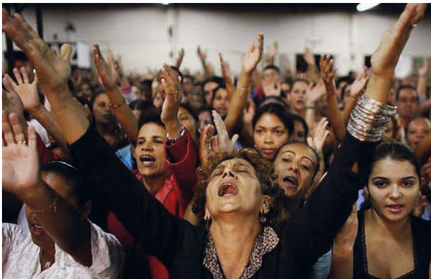
Figura 10. Pentecostales alaban a viva voz. Fotografía extraída de https://editoriallapaz.org/pentecostalismo_Pablo_Y_Chile.jpg Fecha de última consulta 20 de Julio de 2023.

Otro conjunto de creencias que confluyen en este complejo entramado de relaciones es el sostenido y reproducido por los pastores, sobre todo teniendo en cuenta la fuerte presencia pentecostal en la región del sur de Neuquén. Porque hay diferencias que pueden marcarse entre la palabra del «shamán» y la del «pastor» —resumimos en estas dos figuras una gran variedad de estilos y personajes depositarios de autoridad, potencia y poder sobre el demonio de lo no terrenal—. Según lo exponen Kalinsky y Arrúe, la voz del «shamán» es una red vincular de comunicación, tiene un don que le permite ser el intermediario de dioses y antepasados. No dice la forma en que las cosas deben ser, sino cómo cree que son, o pueden llegar a ser, es el encargado de dar el sentido que pueden tomar las cosas. La palabra del «shamán» no admite verdades ni escenarios últimos, inscribe sentidos dando lugar a movimientos y alternativas.