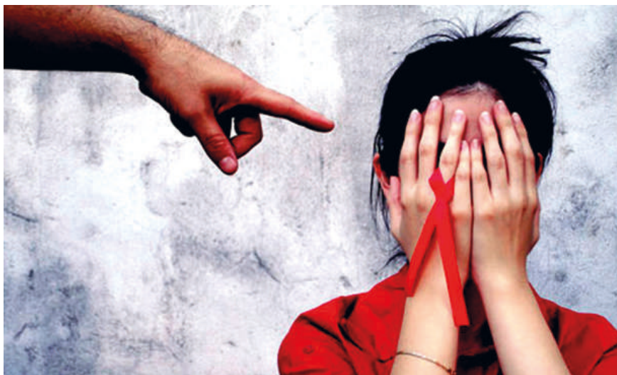
Figura 2. En el tema del VIH-Sida el desconocimiento y la estigmatización van de la mano.

Relacionado a ello, se pone en evidencia una cuestión que tiene que ver con una problemática sociocultural que excede la competencia médica. Porque el argumento basado en «grupos de riesgo» se interconecta junto a los prejuicios preexistentes, y configuraron una representación social del sida como un «problema de otros», obstaculizando una efectiva campaña de prevención de la enfermedad.