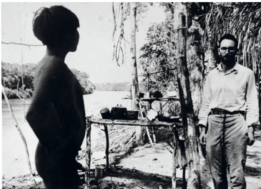
Figura 3. Lévi-Strauss y un Karia.

Retomando el planteo de Rosana Guber podemos decir que «el trabajo de campo antropológico se fue definiendo como la presencia directa, generalmente individual y prolongada, del investigador en el lugar donde se encuentran los actores-miembros de la unidad sociocultural que desea estudiar» (1991:83). Para clarificar esta definición tenemos que precisar qué se entiende por «campo» en antropología. El campo de una investigación socioantropológica es su referente empírico, la porción de lo real que se desea conocer, mundo natural y social en el cual se desenvuelven los grupos humanos que lo construyen. Se compone, en principio, de todo aquello con lo que se relaciona el investigador, pues el campo es una cierta conjunción entre un ámbito físico, actores sociales y actividades. Es un recorte de lo real que se circunscribe de acuerdo con las interacciones y relaciones cotidianas, personales, y posibles entre el investigador y los informantes, actores sociales objetos de investigación, al mismo tiempo que brindan información para la misma.