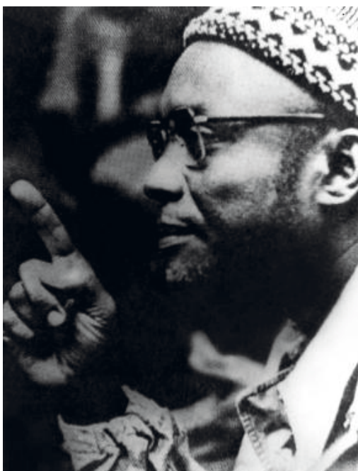
Figura 4. Amílcar Cabral en UNESCO 1972.