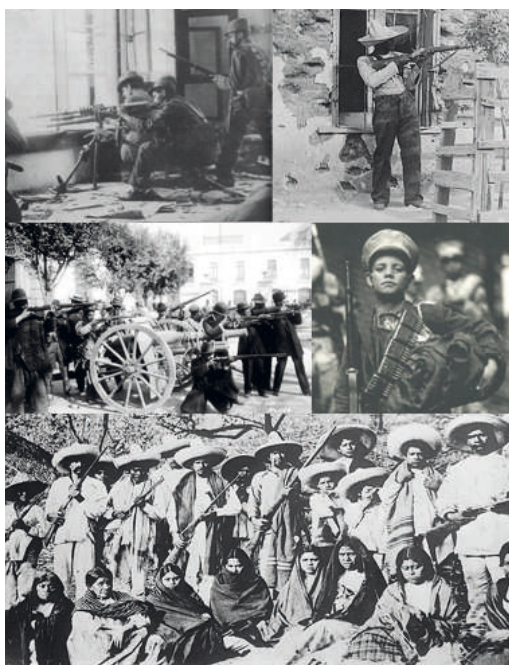
Figura 5. Revolución.

La historia latinoamericana esta llena de acontecimientos trascendentes a lo largo del siglo xx, destacaremos para nuestros fines a la Revolución Mexicana de 1910 y la Revolución Nacional de Bolivia de 1952. En México se lleva a cabo una revolución social y campesina que persigue el objetivo de reparar las injusticias arrastradas de la época colonial, que habían significado el despojo de las tierras de los indígenas, el sometimiento a un régimen de esclavitud, y la negación de la propia lengua y cultura de los pueblos indígenas.