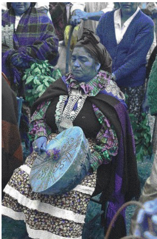
Figura 9. Ritual guiado por la «machi». El término «machi» hace referencia a shamán mapuche.

En la actualidad existe cierta apertura en la religión mapuche que ha permitido que se despliegue una flexibilidad en el uso de factores provenientes de otros sistemas de conocimiento, que se ponen en práctica en las curaciones populares. En ellas, si bien hay un predominio de la palabra (rezos, cantos), hay desde luego una clara noción de las posibilidades que puede brindar el hospital para casos que no pueden ser incluidos en su competencia. Además, el uso de medicamentos patentados —de diagnósticos de la medicina oficial (de la gente «blanca») y la vacunación—, son ejemplos que forman parte de la parafernalia shamánica.