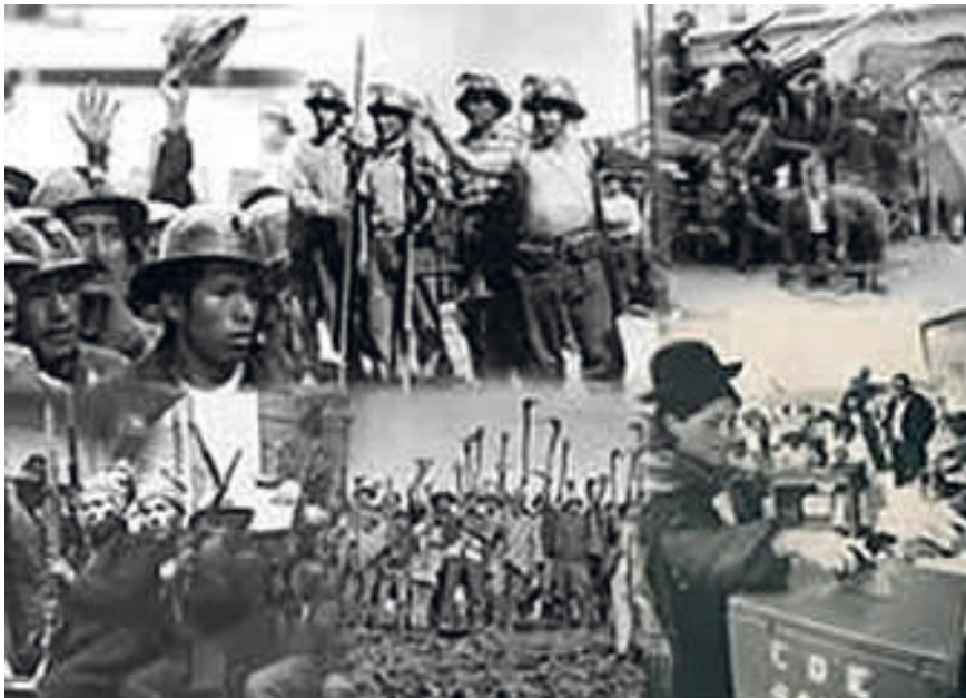
Figura 6. Mineros, campesinos y obreros lideraron la revolución nacional en 1952.

El proceso revolucionario de 1952 afectó directamente a esta parte de Bolivia, es una revolución liderada por los campesinos, mineros y otros grupos y sectores populares. La revolución pone fin a un sistema similar al feudal, ya que se había heredado de la época colonial el sistema de producción de la hacienda y la comunidad indígena con el pongueaje (prestación personal obligatoria y gratuita), el mitaje (trabajo obligatorio y periódico en agricultura, minas y obras), mukeo (trabajos para la elaboración de chicha), mulero, y la entrega semanal de productos.