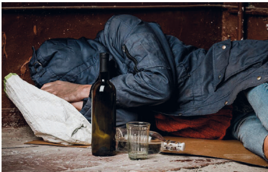
Figura 7. Desde el sentido común se asocia pobreza con alcoholismo.

Las citas enunciadas anteriormente son del trabajo realizado por Beatriz Kalinsky y Willie Arrúe (1996) que aborda diferentes problemáticas de la salud desde una perspectiva socioantropológica en la zona del sur de la Provincia de Neuquén (Argentina), donde hay profundos conflictos interculturales ya que conviven mapuches, criollos, europeos, habitantes de las grandes ciudades, turistas extranjeros, pentecostales y católicos. En uno de sus capítulos trabajan el tema del alcoholismo estudiando cómo en la diversidad de estos grupos humanos hay diferentes modos de pensar, hacer y sentir, complejizando el panorama del consumo de alcohol en esa región, pero que nos puede servir de guía para repensar las ideas y concepciones que normalmente circulan en torno a las personas alcohólicas en nuestras sociedades contemporáneas.