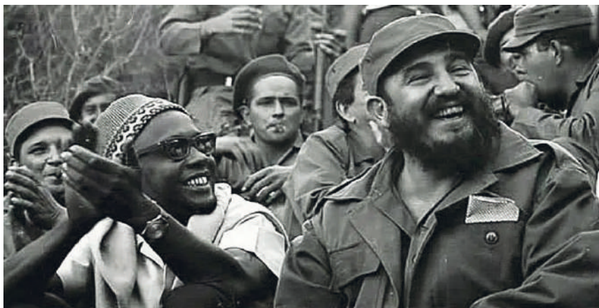
Figura 3. Amílcar Cabral (1924–1973).