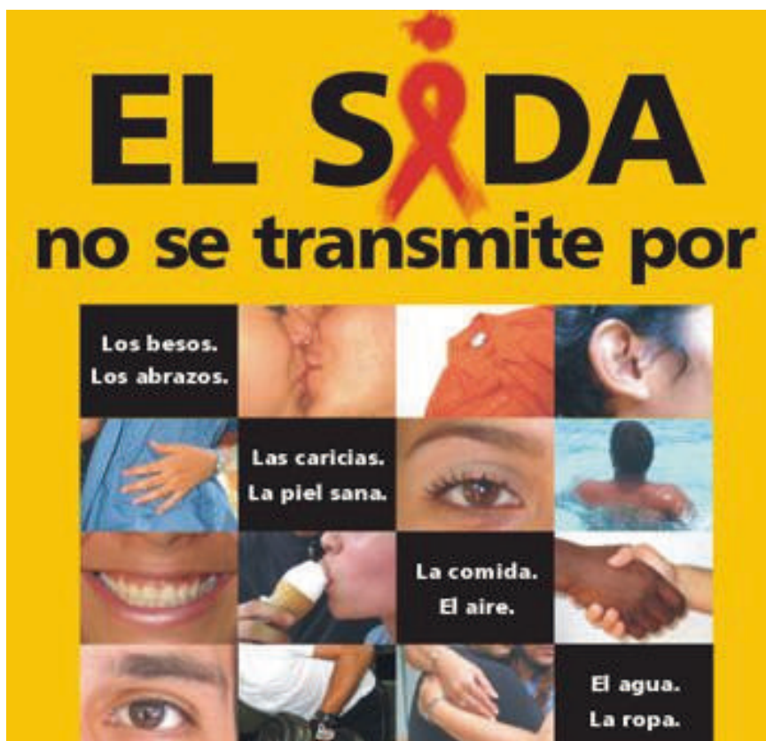
Figura 3. Campaña de concientización sobre transmisión del SIDA. Afiche-propaganda extraído de https://www.mendoza.gov.ar/wp-content/uploads/sites/16/2016/03/sida-material.pdf Fecha de última consulta 20 de Junio de 2023.

Ese «todo social» homogéneo, armónico, ahistórico, que niega las diferencias, pone de manifiesto, en última instancia, una frontera que separa la salud de la «enfermedad»; es decir, sanos versus infectados (portadores de VIH+ y enfermos). Ese límite oculto, no manifiesto pero presente en el modelo, nuevamente obstaculiza la prevención. El límite, en verdad, existe. Sin embargo, creemos que debería ser resignificado positivamente: tanto portadores como no portadores están comprometidos en la totalidad de la problemática preventiva. (Barreda y Moya, 1995:72)