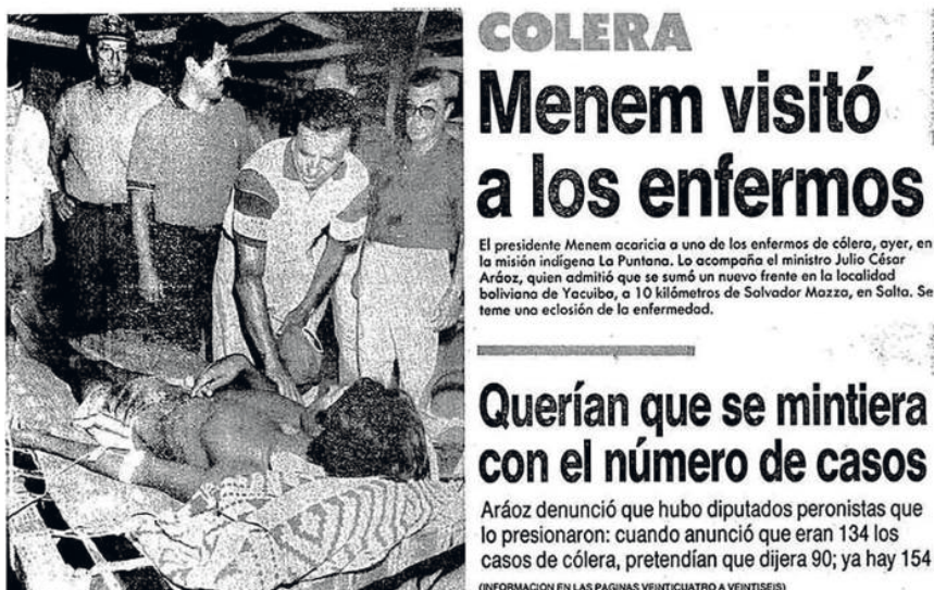
Figura 5. Recorte de diario durante la epidemia de cólera en Argentina.

La lucha contra el cólera estaba preparada, funcionó el sistema de atención primaria de la salud, con los agentes sanitarios... lo que no funcionó y no es culpa de los agentes fue la concientización de la gente, la influencia de culturas diferentes, sobre todo en las comunidades aborígenes del Bermejo y del Pilcomayo, sin duda fue un gran obstáculo. Sin duda que toda zona de economía de subsistencia implica una marginación de la gente que vive en ella. Porque no hay empresarios o porque no hay una organización económica, o por el propio aislamiento que provocan las diferencias culturales. 2