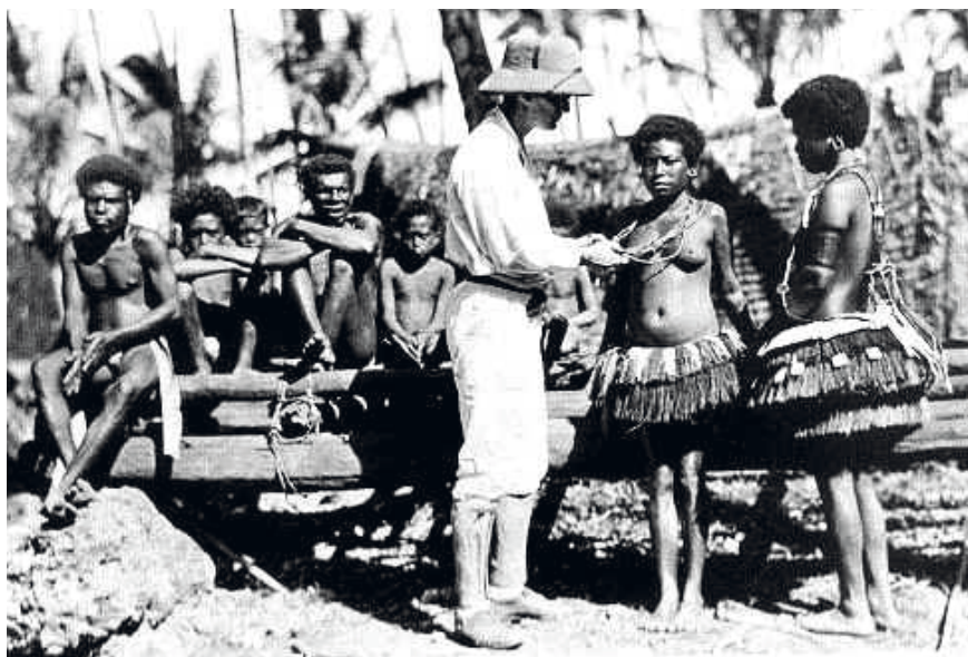
Figura 4. Malinowski fotografiado junto a una tribu en las islas Trobriand.

Si tenemos en cuenta a la observación como técnica de investigación, debemos caracterizar y marcar las diferencias entre observación directa y observación fílmica o diferida ; observación participante o con participación , y observación sin participación . Esta última variante de observación hace referencia a la permanencia del investigador en el campo, pero sin interactuar con los actores sociales; el investigador se mantiene al margen de las actividades, se mantiene distante sin entablar vínculos con los actores sociales.