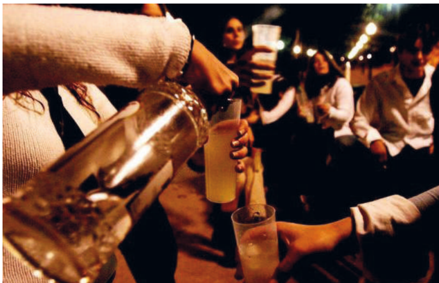
Figura 6. Es preocupante actualmente el consumo de alcohol en los jóvenes.

En otro sentido, está la idea comúnmente compartida, por gran parte de la sociedad, de que los que se embriagan, «los borrachos», como se los cataloga vulgarmente, son personas que no les interesa trabajar por lo que viven miserablemente y lo único que buscan es conseguir una moneda para poder tomarse un trago y evadirse de la realidad.