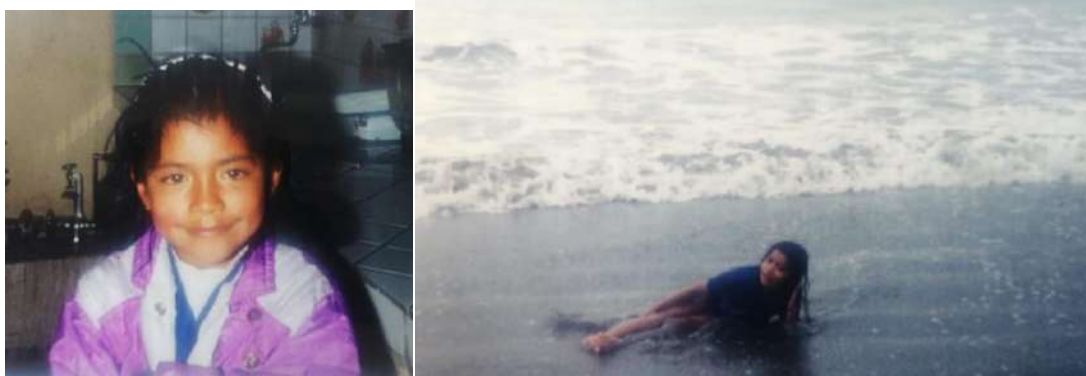
Imagen 1 y 2: Fotografías propias del álbum familiar durante los años noventa.

“mamá, el negro me va a comer” (Fanon, 1986: 113- 114)