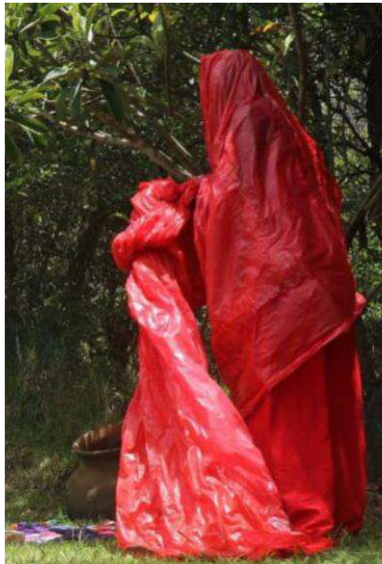
Imagen 6. Performance: “Des-Archivo documental Huitaca . Nuestra piel el lienzo para responder las 37 cartas de las familias buscadoras”

Con lo cual, la performance a lo largo del laboratorio se convirtió en un ejercicio poético de resistencia, de rebeldía y sobre todo de repudio. El sentimiento de repugnancia puede ser también un elemento en una política que busca cuestionar lo que es (Ahmed, 2015, p.158).