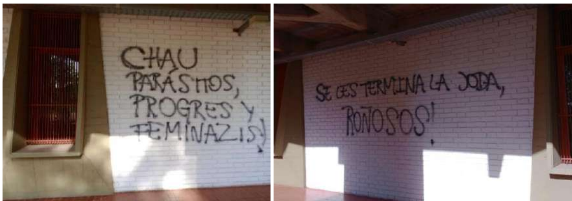
Fotografías 1 y 2: archivo propio. Dos de las pintadas sobre las paredes del edificio de la FCPyS, UNCUIYO.

El odio escrito en la superficie de las paredes de la universidad, a días del ballottage electoral en las que se impondría la derecha fascista.