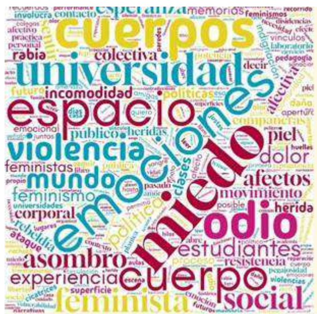
Imagen 1: Mapa de las palabras presentes con mayor frecuencia en las bitácoras. Taller de sentipensar.

Posteriormente, en el proceso colectivo llegamos a una composición sin saber a dónde íbamos; descubrimos un mosaico de lo que atravesamos, un tejido colectivo de voces, reflexiones y miradas, formas de observar que, encuentro a encuentro, sumaban color a esta composición colectiva, a esta forma de tejer reflexión conjunta.