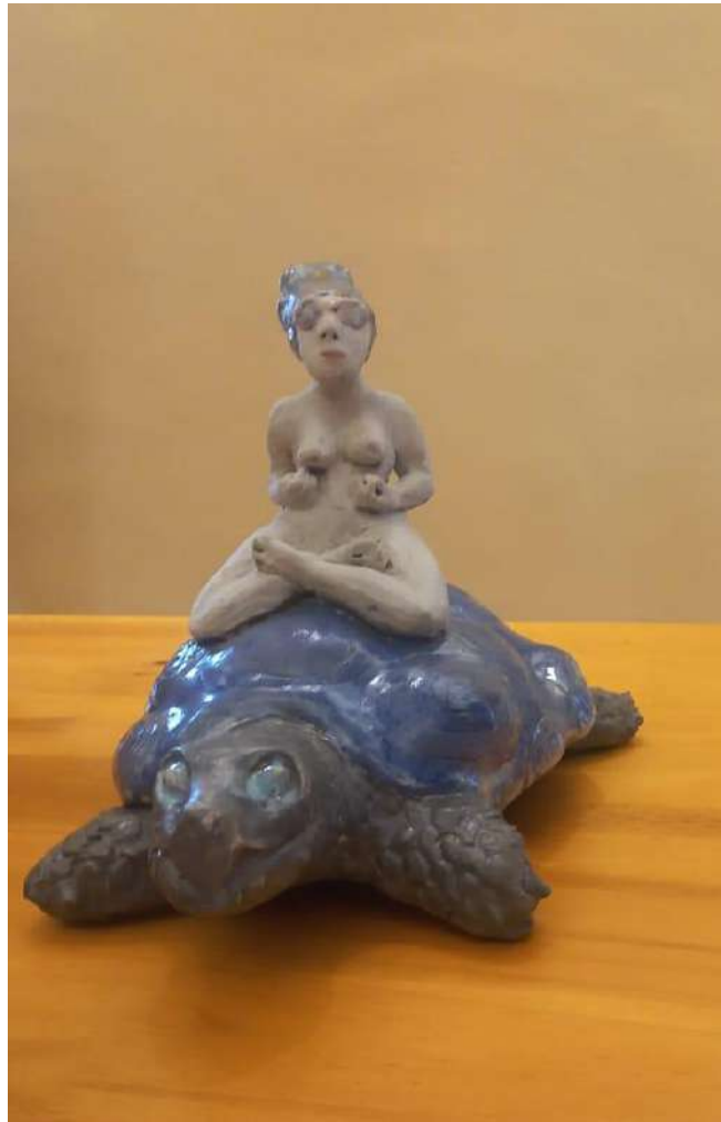
Imagen 2: “Persiguiendo la utopía”. Exposición Feminíridas de Verónica Trujillo. 2025

futuros posibles, por la creatividad y la insistencia en buscar formas diferentes de relacionarnos. Esta esperanza resonó hace algunos días con la pieza cerámica “Persiguiendo la utopía” de la artista Verónica Trujillo que tuve la oportunidad de apreciar en la exposición Feminíridas.