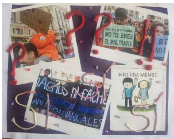
Imagen 1: archivo propio. Collage que acompaña la portada de presentación del TFI, se han recortado los datos personales para preservar la identidad de la estudiante.

“Dado que no es que los sentimientos compartidos impliquen sentir el mismo sentimiento, o sentir-en-común, sugiero que lo que circula son los objetos de la emoción, y no tanto la emoción como tal” (Ahmed, 2015, p. 35). Compartiré una experiencia pedagógica desarrollada en el espacio curricular de ESI- -educación sexual integral- durante el año 2022. En la formación de Psicólogos Sociales en la CABA - Argentina, se incorpora el espacio curricular de ESI de carácter obligatorio para todos los años de cursada. El programa incluye: el concepto de género, su proceso histórico y sus posibilidades como analizador social. Se profundiza el enfoque biomédico con el objetivo de conocer el propio cuerpo para cuidar y promover la salud y prevenir enfermedades. Por último, se aborda el enfoque de derechos con el marco legal internacional y nacional tendiente a la construcción de la democracia sexual 1 .