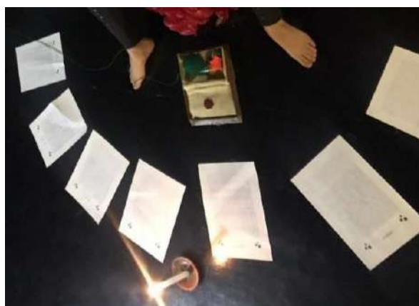
Imagen 4 y 5. Fotos de Artemisa danza-Laboratorio de “Des-Archivo”