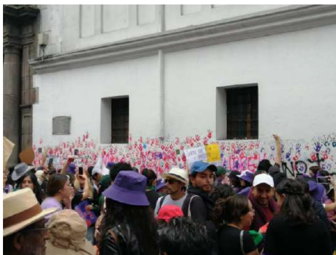
Imagen 5: Fotografía tomada en la marcha del 8M de 2025 en Quito, Centro Histórico.