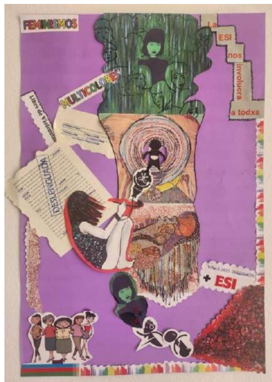
Imagen 2: archivo propio. Collage “Sentir el propio camino”, por Gabriela A. Ramos

A través de las emociones, el pasado persiste en la superficie de los cuerpos. Las emociones nos muestran cómo se mantienen vivas las historias, incluso cuando no se recuerdan de manera consciente. El tiempo de la emoción no se refiere siempre al pasado, y a como este se queda pegado. Las emociones también abren futuros, por las maneras en que implican diferentes orientaciones hacia los otros. Toma tiempo saber lo que podemos hacer con la emoción (...) (Ahmed, 2015, p. 304).