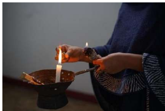
Encuentro “Tejiendo resistencias”, 07 de marzo de 2025