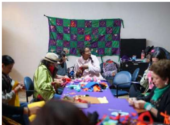
Encuentro “Tejiendo resistencias”, 07 de marzo de 2025

Los hilos entrelazaban memorias, afectos y experiencias compartidas, y la “pegajosidad” de los afectos se adhería a la tela. Como señala Ahmed (2015, p. 150), esta pegajosidad se entiende como “la acumulación de valor afectivo (...) no se relaciona con las convenciones explícitas, sino con los vínculos implícitos que determinan cómo los signos funcionan en relación con otros signos”. En el acto de coser, estas fuerzas invisibles se hicieron palpables, mostrando cómo emociones, recuerdos y relaciones atraviesan cuerpos, materiales y prácticas compartidas.