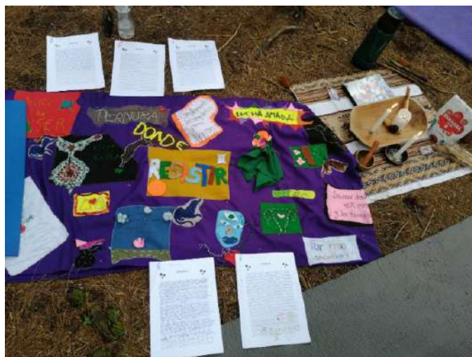
Imagen 4: Fotografía tomada entre marzo-abril de 2025 en el parque metropolitano La Armenia en la sesión de lectura de las cartas de las madres y familias buscadoras de México

Ahora, con una vida en mis manos y que aún depende de mí para acercarse y conocer el mundo la frase de Ahmed “el miedo funciona para restringir a ciertos cuerpos a través del movimiento o expansión de otros.” (2015, p. 116), advierto que el miedo como construcción sociocultural e histórica, también se transmite desde esa memoria genética, sin embargo, la posibilidad de reconstruir las/nuestras historias de vida también hallan asidero en las formas de narrar y narrarnos en el presente desde la sanación de nuestros pasados.