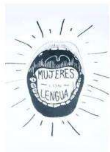
Imagen 2: archivo propio. Logo del colectivo “Mujeres con Lengua”.

Al mismo tiempo, recordé cómo en esos años la inmensa marea verde también había llegado al profesorado dando inicio a numerosas denuncias hacia docentes y compañeros varones por parte de mujeres y disidencias. Aparecía la indignación, la rabia y el dolor. Resuenan las palabras de Ahmed cuando menciona que “La tarea sería no solo leer e interpretar el dolor como sobredeterminado, sino también hacer el trabajo de traducción, mediante el cual el dolor se lleva hacia el ámbito público y, al moverse, se transforma. Si queremos alejarnos de vínculos que son dolorosos, debemos actuar sobre ellos (...)” (Ahmed, 2015, p. 263). Y actuamos. Nos organizamos y juntamos docentes y estudiantes para darle forma al movimiento “Mujeres con lengua” del profesorado en donde redactamos documentos, discutimos sobre la activación de protocolos e hicimos intervenciones en la institución.