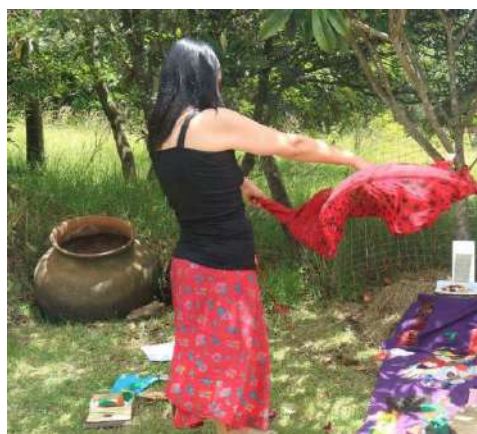
Performance “Encarnando a la Huitaca”, 10 de agosto de 2025