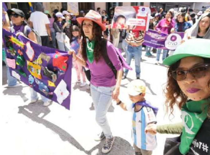
Imagen 6: Fotografía tomada en la marcha del 8M de 2025 en Quito, Centro Histórico.

Finalmente, así como Ahmed transita por diversas emociones atravesadas por el miedo, el odio, el repudio, personalmente, y antes de conocerla y leerla, pude caminar por cada una de esas emociones durante años, mientras revisaba su texto en el círculo de lectura pude revivir ese camino, lo maravilloso fue que ahora lo hice con otras mujeres, compañeras, amigas y entonces el tránsito fue más ligero, doloroso al fin pues trabajar la memoria tiene esos riesgos, sin embargo esperanzador, criar a un niño desde otras sensibilidades, afectos y realidades me resulta profundamente inspirador, sin romantizar en absoluto la maternidad y más aún en solitario. Las imágenes 4, 5 y 6 representan para mí la posibilidad de sentir y expresar el miedo desde la ternura, que, aunque suene paradójico, me significan potencia y vitalidad.