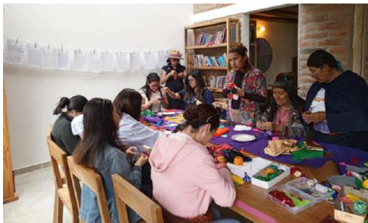
Imagen 3. Foto de la Colectiva Rebeldes con Causa- “Yuyanik Encuentro de la memoria y la palabra viva 2025”