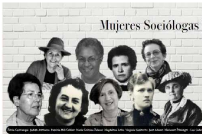
Mural de mujeres sociólogas Edificio Orlando Fals Borda. Universidad Nacional de Colombia, 2025.

En el año 2004 cursaba mi octava matrícula en la carrera de sociología de la Universidad Nacional de Colombia. Desde la Maestría en sociología, se promocionaba el afiche promocional de la convocatoria para una nueva cohorte. De esquina a esquina, el cartel estaba compuesto por la imagen de los autores referentes de la disciplina. Junto a la sagrada trinidad de Durkheim, Marx y Weber, se incluyeron a los colombianos Mesa, Torres y Fals Borda. Debo admitir, que no me despertó sorpresa verlo, de hecho, me gustó y me pareció un orgullo identificar en la pieza a todos los autores de mi disciplina. Aunque me encontraba a la mitad del camino de formación como socióloga, no me sorprendí con esa imagen, ni me cuestioné la norma social que expresaba.