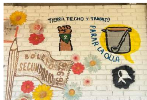
Fotografías 3, 4 y 5: archivo propio. Mural realizado en la FCPyS. Sobre la pintada “no enseñan, adoctrinan”, estudiantes re-escriben: “nos enseñan, no adoctrinan”.