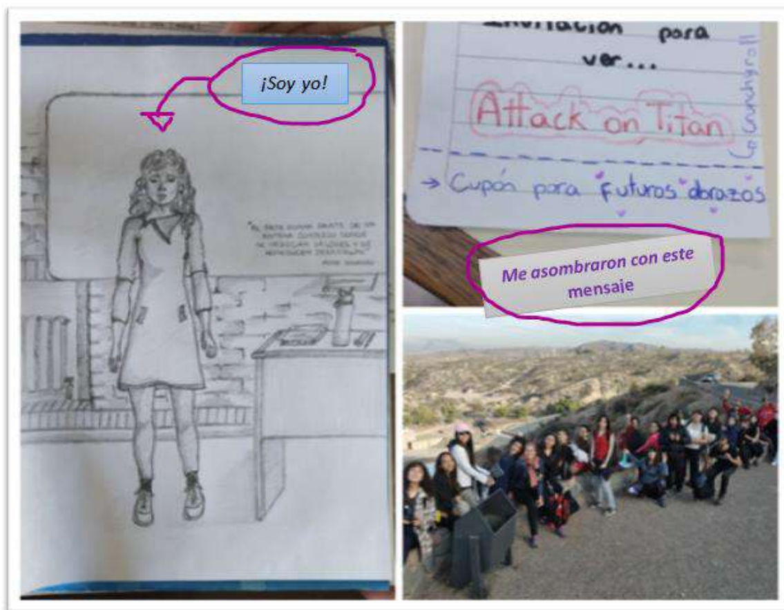
Imagen 2, 3 y 4: fotografías propias acerca de las Experiencias y huellas del intercambio pedagógico

Nota: Captura de pantalla que saqué de la sección Sugerencias (2024).